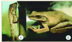
1. กิ่งก่า กินแมลงขนาดเล็ก 2. ปาด กินแมลงขนาดเล็ก