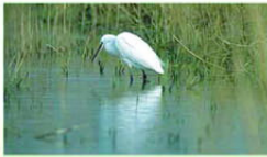
นก กินแมลงเป็นอาหาร