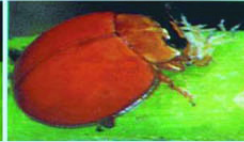
ด้วงเต่าตัวทำ กัดกินแมลงศัตรูพืช เช่น ไช้แมลง ตัวอ่อน และตัวเต็มวัย ของเพลี้ยอ่อน เพลี้ยแป้ง เพลี้ยหอย เพลี้ยไฟ ไร