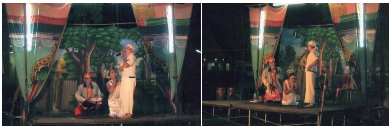
ภาพที่ 4 แสดงภาพการแสดงลำเรื่องปรีญาไม่เลือกงาน ฉากกานดาขอขมาแม่ลำดวนและขอให้แม่กลับบ้าน

บ้านด้วยแต่คุณนายลำดวน ขอจำศีลอยู่ที่วัดแห่งนี้เพื่อทำสมาธิ กานดาและสมเพศจึงกราบลาแล้วก็ได้มาทำบุญที่วัดแม่ลำดวนอยู่เป็นประจำ