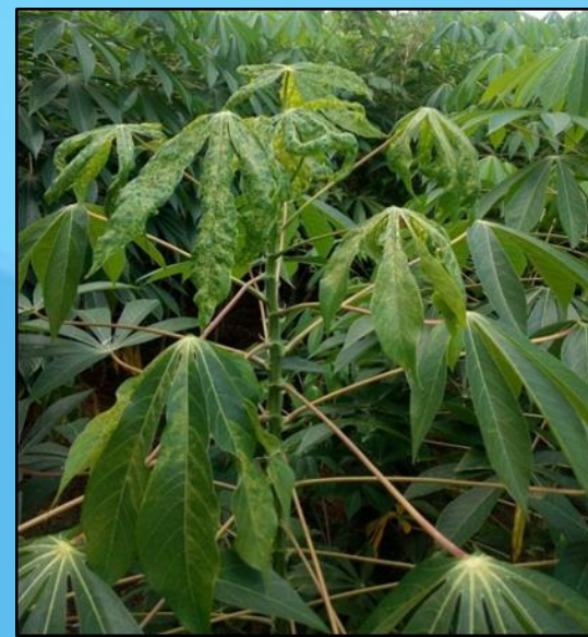
ใบด่างเหลืองชัดเจนที่ส่วนยอด แต่ใบล่างยังปกติ เนื่องจากรับการถ่ายทอดโรคจากแมลงหิวขาอายุสุบที่มีเชื้อไวรัสจึงแสดงอาการรุนแรงจากส่วนยอดลงมาสู่ใบล่างของต้น