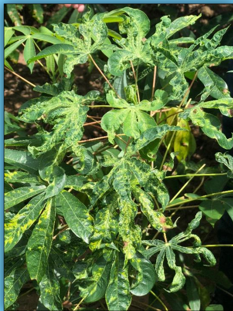
ใบย่อยบิดเบี้ยวหงิกงอ โค้งเสียรูปทรง

ใบอ่อนและใบที่เจริญใหม่มีขนาดเล็กลง ยอดหงิก ต้นแคระแกร็น