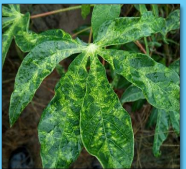
อาการต่างเขียวขีดสลับเขียวเข้ม