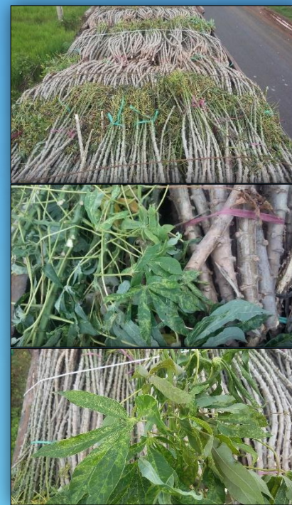
อาการใบด่างบนท่อนพันธุ์มันสำปะหลัง

เฝ้าระวังและป้องกันท่อนพันธุ์ติดโรคใบด่างมันสำปะหลัง