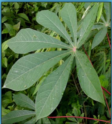
ใบมันสำปะหลังปกติ

หมั่นเดินตรวจแปลงตั้งแต่เริ่มปลูกทุกๆ 2 สัปดาห์ หากพบอาการต้องสงสัยเช่น ใบหงิก ใบด่าง ให้แจ้งเจ้าหน้าที่กรมวิชาการเกษตร หรือกรมส่งเสริมการเกษตรในพื้นที่มาวินิจฉัยโรค เจ้าหน้าที่จะชุดถอนทำลายต้นต้องสงสัยออกจากแปลง นำไปฝังกลบ พ่นต้นที่เหลือในแปลงและแปลงข้างเคียงด้วยสารฆ่าแมลงเพื่อทำลายแมลงหิวขาอายุสุบ ติดตามการเกิดโรคใบด่างในแปลงอย่างต่อเนื่องทุก 2 สัปดาห์