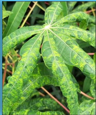
อาการต่างเหลือง