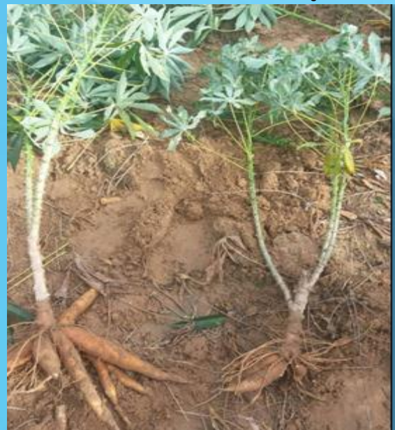
หัวมันสำปะหลังจากต้นปกติเปรียบเทียบกับต้นที่เป็นโรค