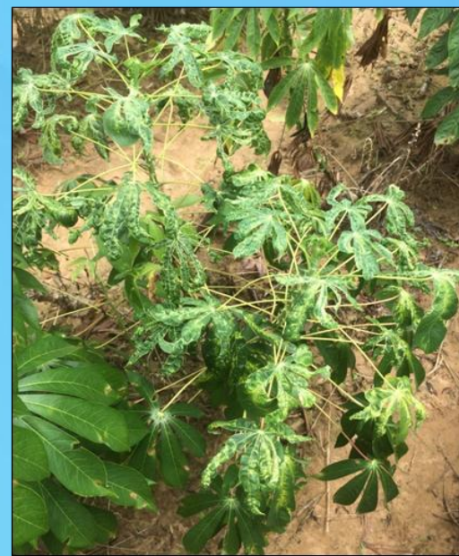
ใบด่างเหลืองทั้งใบยอดและใบล่างเนื่องจากใช้ท่อนพันธุ์ที่เป็นโรคมาลูก