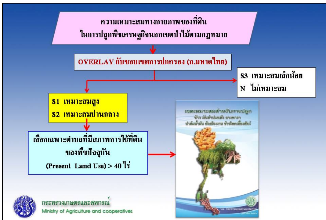
รูปที่ 8-3 ขั้นตอนการจัดทำบัญชีแนบท้าย เรื่องเขตเหมาะสมสำหรับการปลูกพืชเศรษฐกิจ