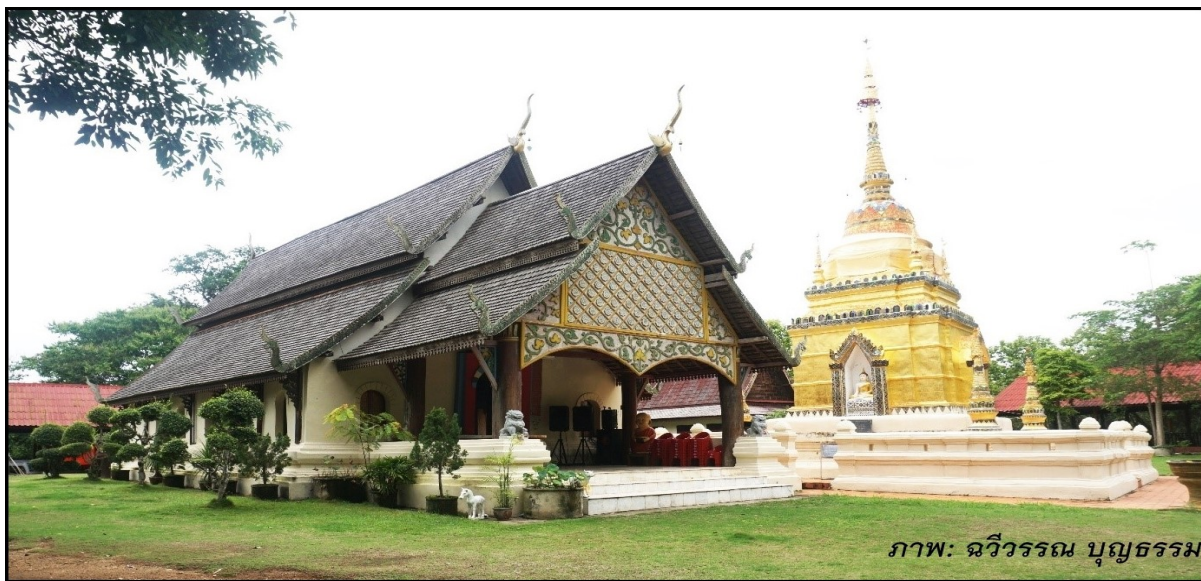
ภาพ: ฉวีวรรณ บุญธรรม