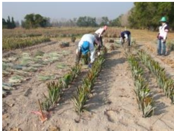
การปลูกแบบแถวคู่