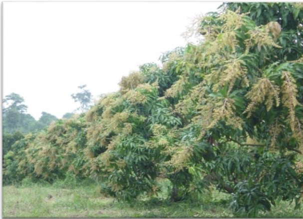
การออกดอกติดผล