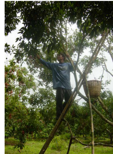
เก็บเกี่ยวหลังดอกบาน 4 เดือน