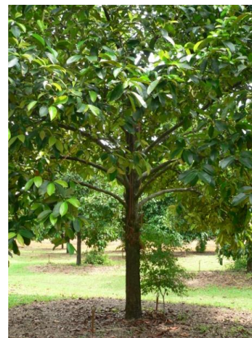
การตัดแต่ง และควบคุมทรงพุ่ม ช่วยลดต้นทุนการจัดการต่างๆ และยังให้ผลผลิตคุณภาพ