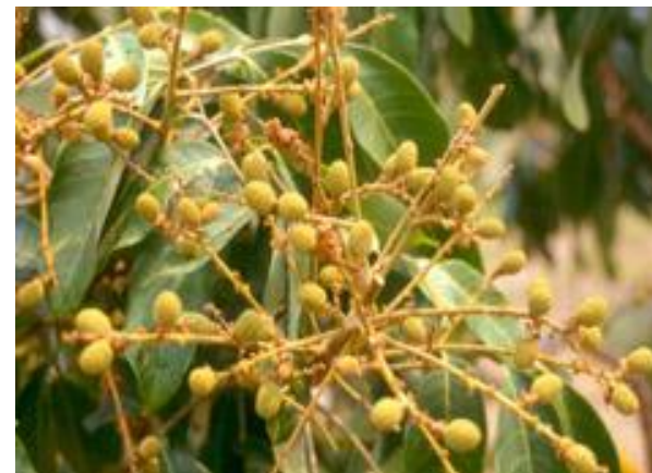
การตัดแต่งผลที่เหมาะสม