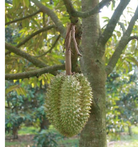
ผลผลิตที่ได้คุณภาพ