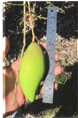
ขนาดผลที่พร้อมห่อ