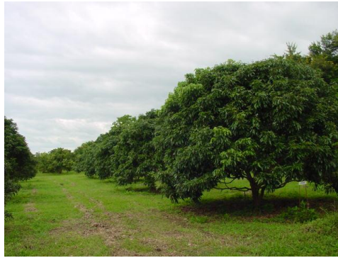
เตรียมพื้นที่ปลูกให้เหมาะสม