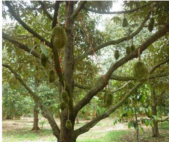
การไว้ผลทุเรียนที่เหมาะสม