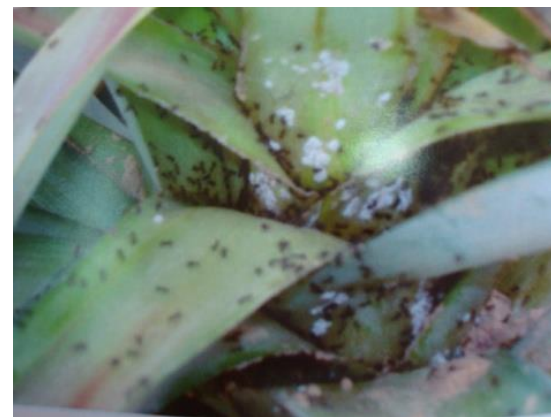
มดและเพลี้ยแป้ง