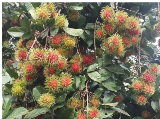
เงาะพันธุ์โรงเรียน