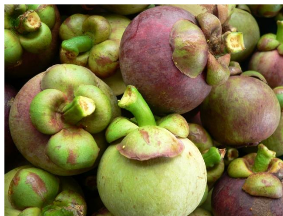
การเก็บเกี่ยว เก็บในระยะสายเลือด และใช้อุปกรณ์ที่เหมาะสม ช่วยลดความเสียหายของผลผลิต เพิ่มผลผลิตที่มีคุณภาพ