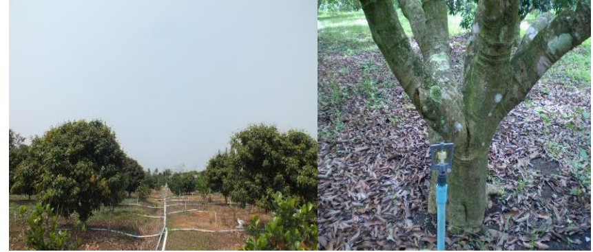
เลือกระบบการให้น้ำแบบหัวเหวี่ยงเล็ก พร้อมให้ปุ๋ยทางระบบน้ำ