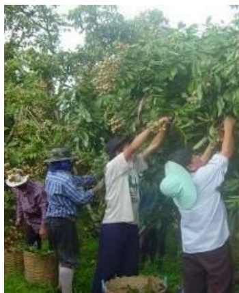
เก็บเกี่ยวลำไยเมื่ออายุผลประมาณ 7 เดือน