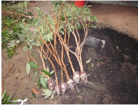
ขยายพันธุ์จากต้นที่สมบูรณ์ปราศจากโรค-แมลง