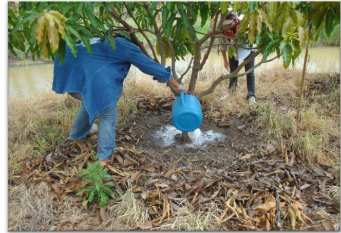
ราดสารพาโคลบิวพาสโซลในระยะใบพวงหรือใบเพสลาด