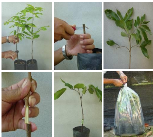
การขยายพันธุ์โดยวิธีเสียบยอด