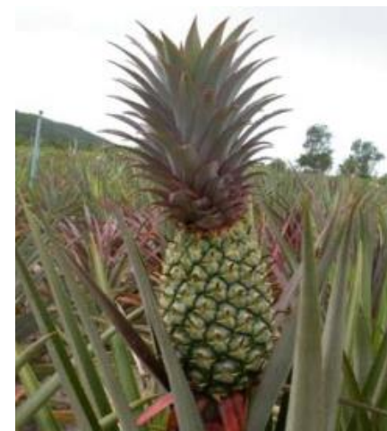
ผลที่พร้อมเก็บเกี่ยว