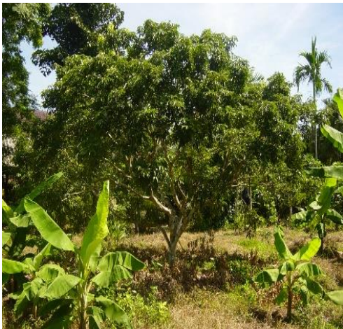
ตัดแต่งกิ่งแบบเปิดกลางทรงพุ่ม