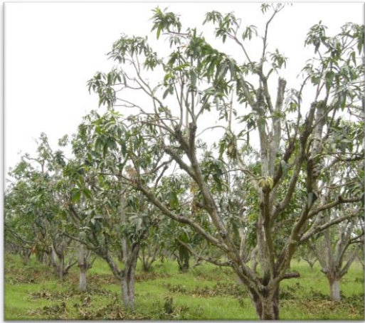
การตัดแต่งกิ่ง