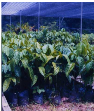
เลือกต้นกล้าที่สมบูรณ์