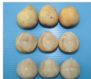
เก็บเกี่ยวเมื่อสีผิวผลเปลี่ยน เป็นสีเหลืองทั้งซ้อ เนื้อผลบาง