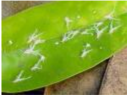
เพลี้ยไก่แจ้