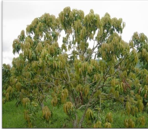
ต้นแตกใบอ่อนพร้อมกัน