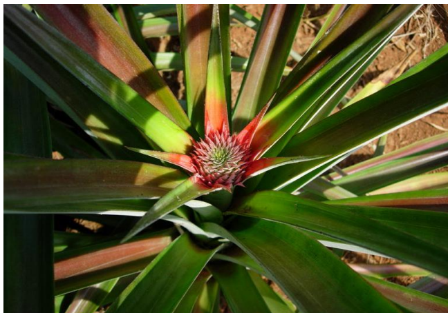
การออกดอก