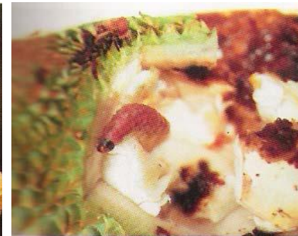
หนอนเจาะเมล็ด