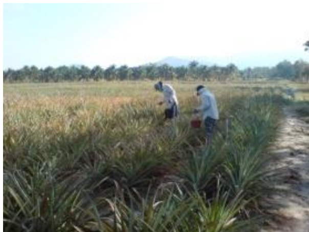
การบังคับดอก