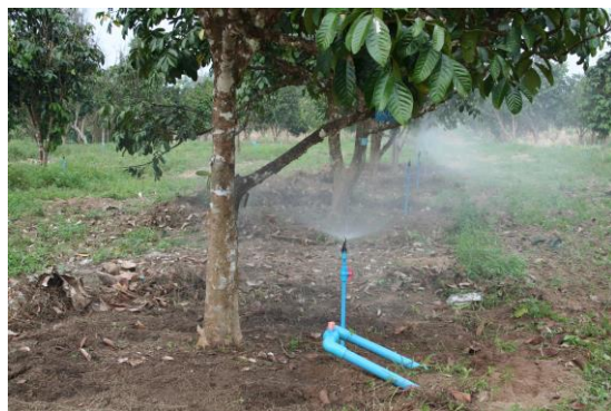
การให้น้ำแบบมินิสปริงเกอร์ ช่วยประหยัดน้ำ