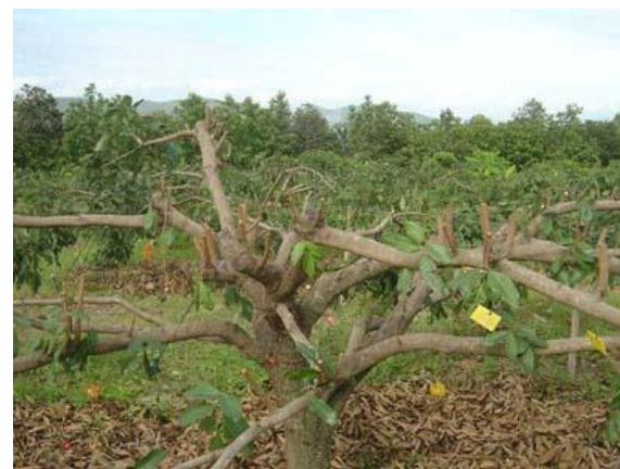
การตัดแต่งกิ่งแบบฟาซีหงาย