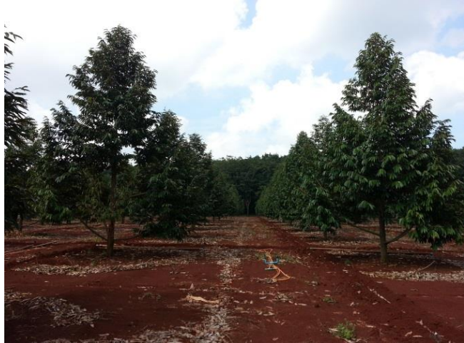
แปลงทุเรียนต้นแบบ