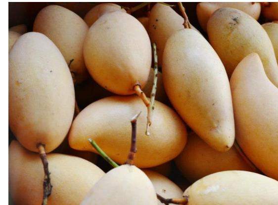
ผลผลิตคุณภาพดี