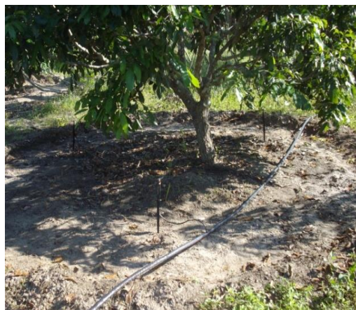
การให้น้ำโดยใช้หัวเหวี่ยงเล็ก