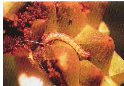
หนอนเจาะผล