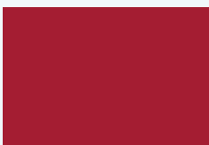
ธงแดง (รัชกาลที่ ๑-๒)