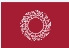
ธงเรือหลวง (รัชกาลที่ ๑)