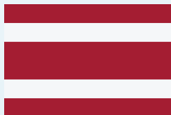
ธงแดงขาว 5 ริ้ว (พ.ศ. ๒๔๕๗)