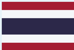
ธงชาติไทย หรือธงไตรรงค์ (ปัจจุบัน)