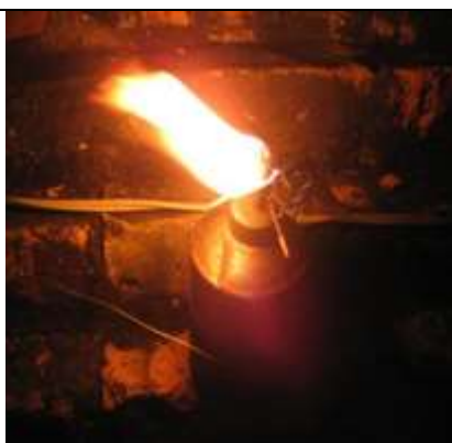
ตะเกียงน้ำมันก๊าด

เด็กวันนี้.....หลายคนคงเกิดไม่ทัน และหากไม่รู้จักตะเกียงน้ำมันก๊าดและตะเกียงเจ้าพายุ ก็ลองดูในภาพประกอบข้างล่างนี้ได้