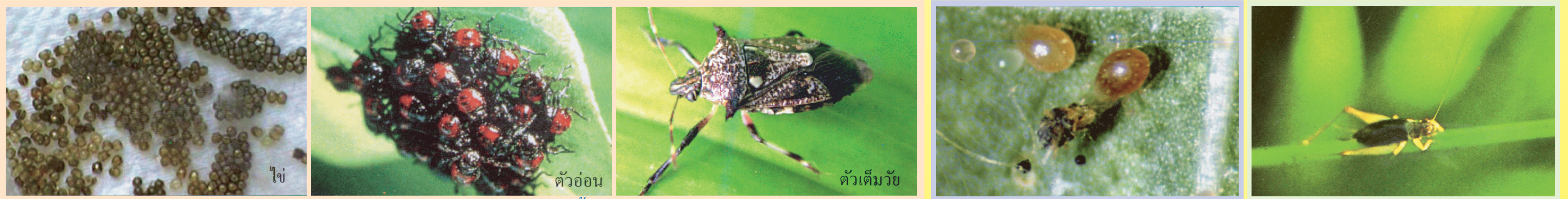
มวนพินาต ระยะตัวอ่อนและตัวเต็มวัยทำลายแมลงศัตรูพืชทั้งระยะตัวอ่อน ดักแด้ และตัวเต็มวัยที่มีลำตัวอ่อนนุ่ม โดยการเจาะดูดน้ำเลี้ยงจากศัตรูพืช