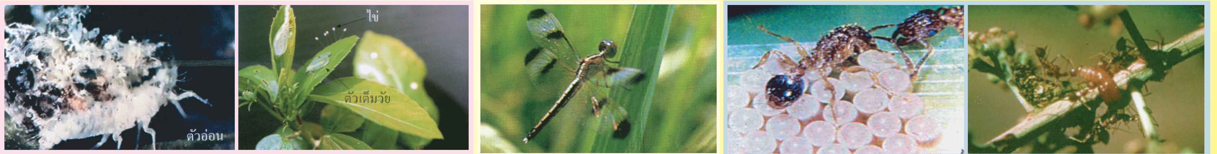
แมลงข้างปีกใส ตัวอ่อนกัดและดูดกินแมลงศัตรูพืช เช่น เพลี้ยอ่อน แมลงหรีขาว หนอนขนาดเล็ก