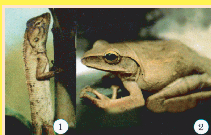
1. กิ้งก่า กินแมลงขนาดเล็ก 2. ปาด กินแมลงขนาดเล็ก