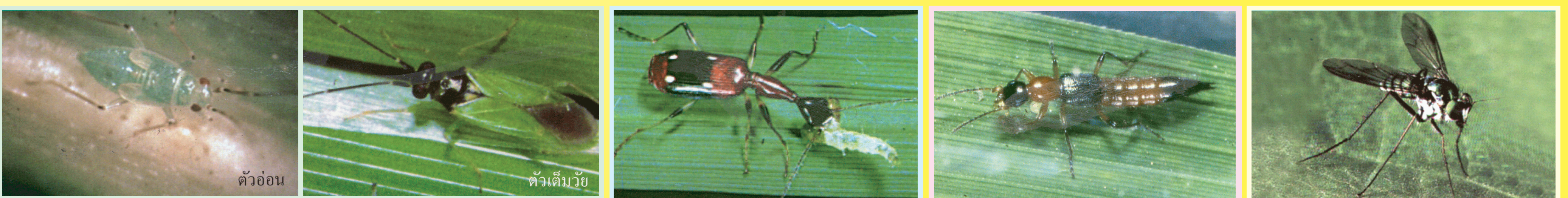
มวนเขี้ยวจุดไข่ ดูดกินไข่เพลี้ยกระโดด เพลี้ยจักจั่น