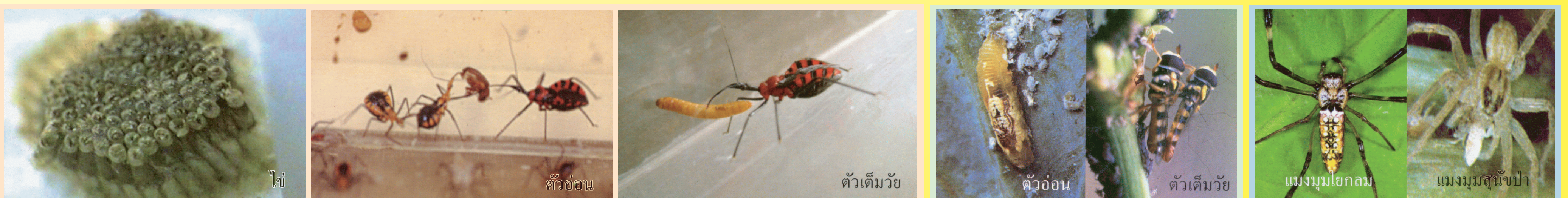
มวนเพชรฆาต ระยะตัวอ่อนและตัวเต็มวัยทำลายแมลงศัตรูพืชทั้งระยะตัวอ่อน ดักแด้ และตัวเต็มวัยที่มีลำตัวอ่อนนุ่ม โดยการเจาะดูดน้ำเลี้ยงจากศัตรูพืช