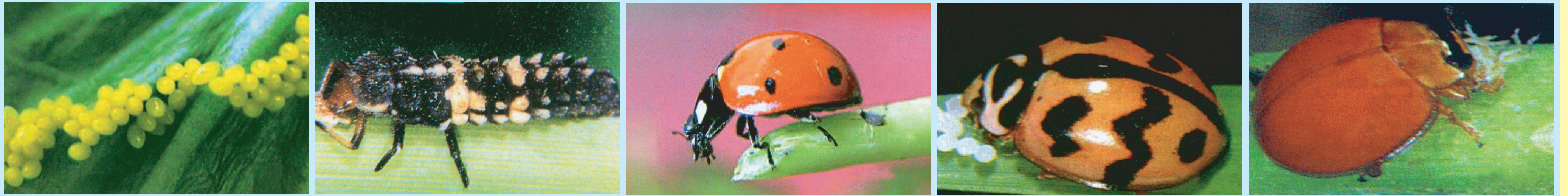
ด้วงเต่าตัวห้ำ กัดกินแมลงศัตรูพืช เช่น ไข่แมลง ตัวอ่อน และตัวเต็มวัย ของเพลี้ยอ่อน เพลี้ยแป้ง เพลี้ยหอย เพลี้ยไฟ ไร

ตัวห้ำที่พบโดยทั่วไป ได้แก่ แมลงตัวห้ำ แมงมุม นก หนู กิ้งก่า ปาด เป็นต้น