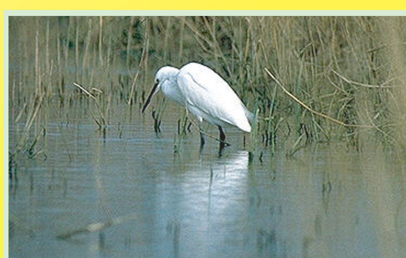
นก กินศัตรูพืชเป็นอาหาร