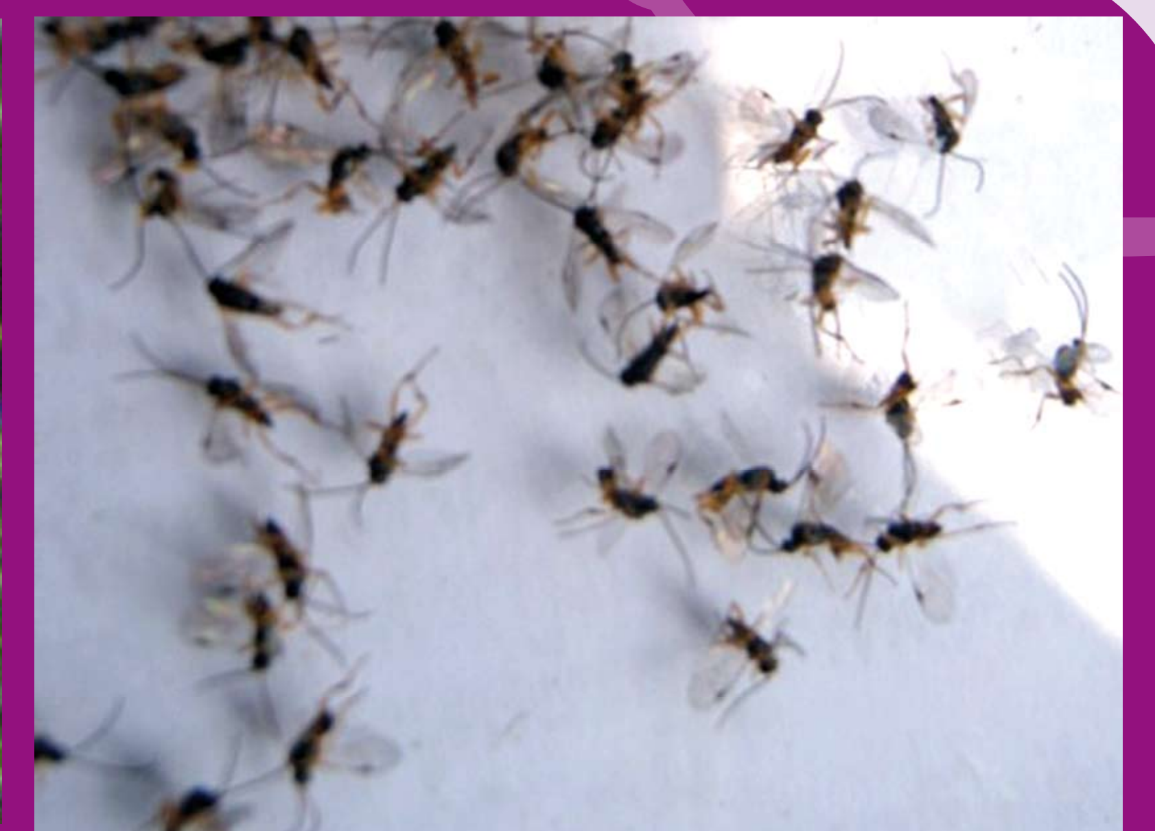
แตนเบียน