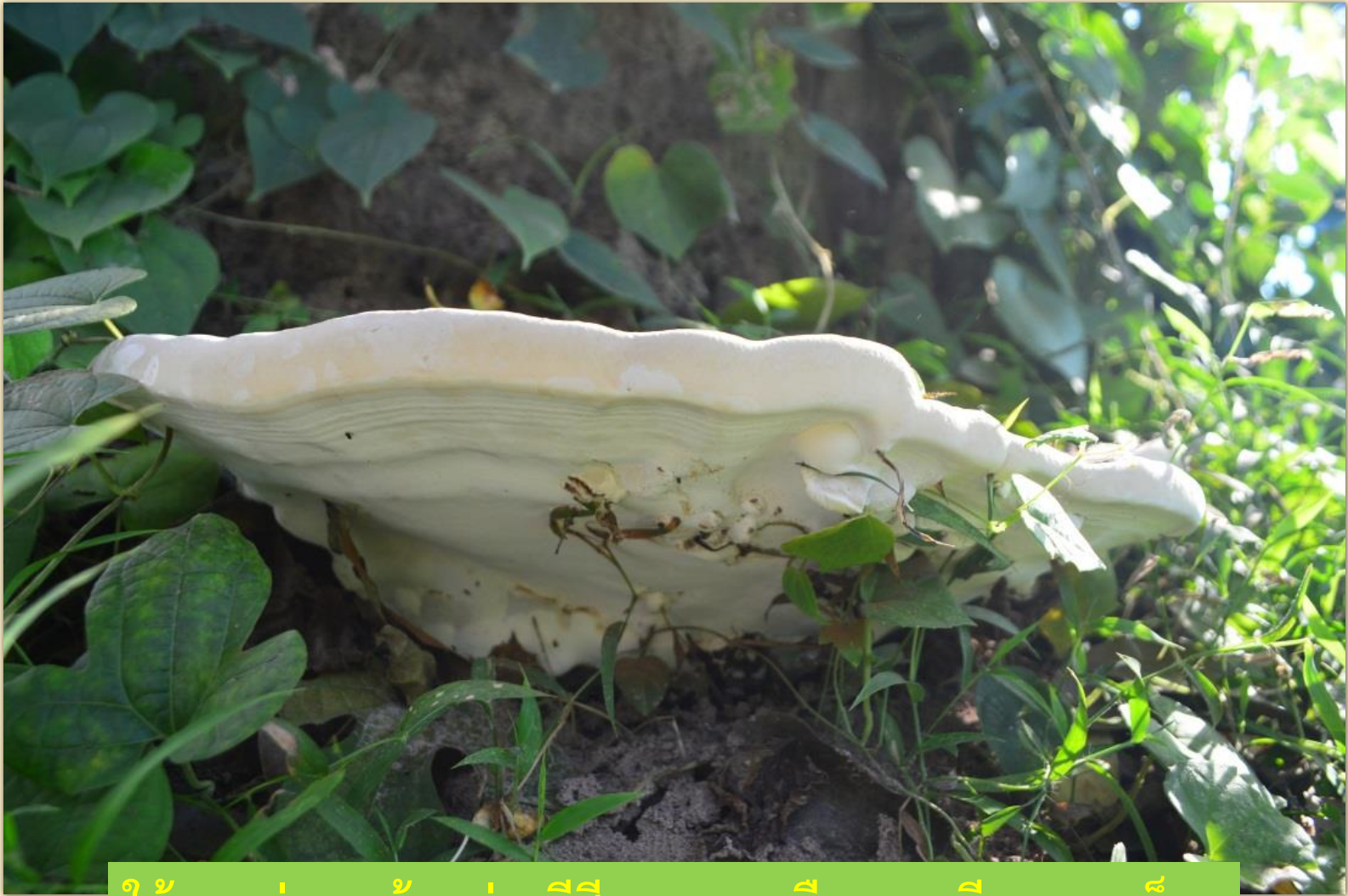
ใต้ดอกอ่อน ด้านล่างมีสีขาวอมเหลืองและมีรูขนาดเล็ก