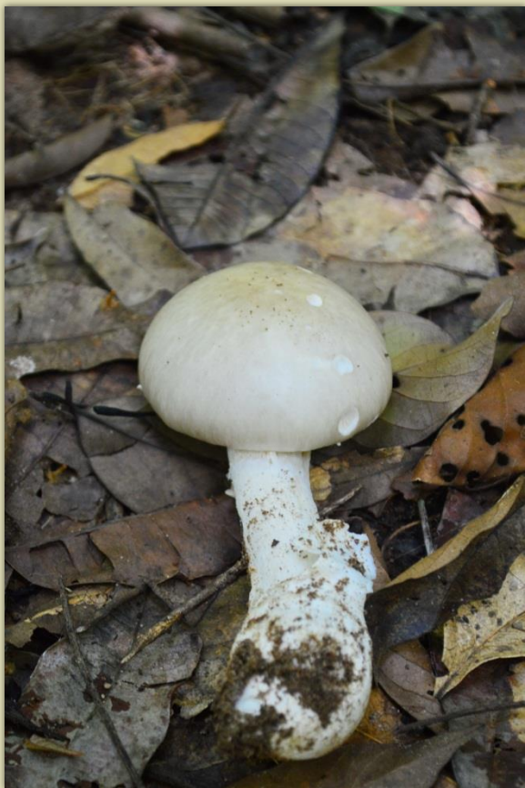
เห็ดระโงกหิน/ระงาก(สีขาว)