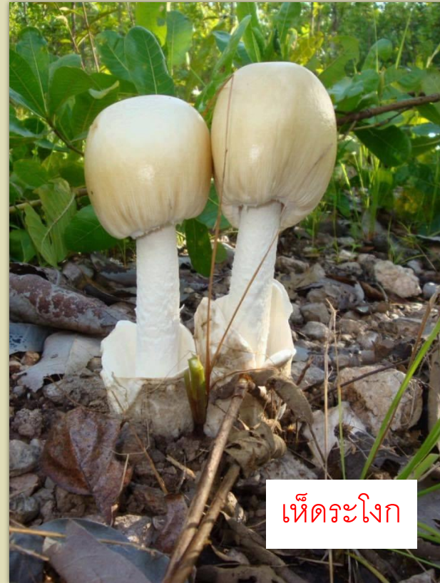
เห็ดระโงก