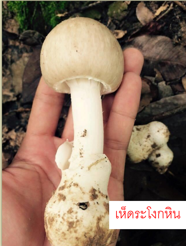
เห็ดระโงกหิน