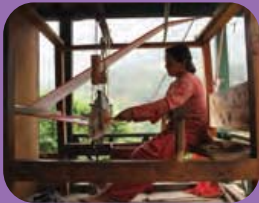
ทอผ้า - WEAVING