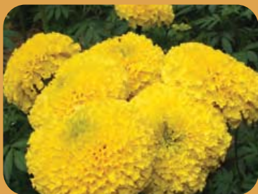
ดาวเรือง