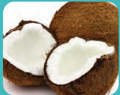
ใยมะพร้าว