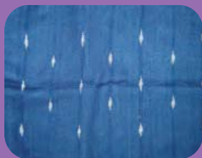
สิ่งทอ - TEXTILE