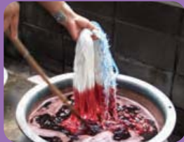
การย้อม - DYING