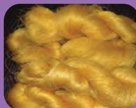
ไหม - SILK