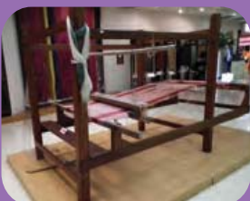
กี่ทอผ้า - LOOM