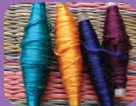
เส้นด้าย - YARN