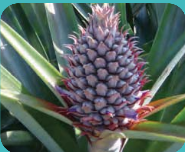
ใยสัปปะรด