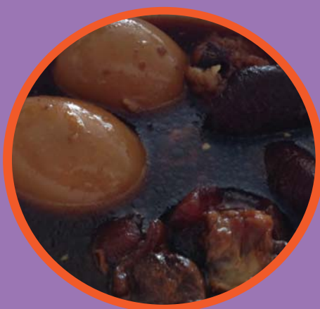
แกงพะโล้