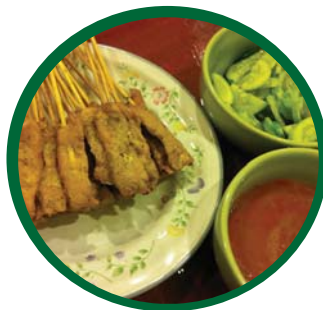
ไก่สะเต๊ะ