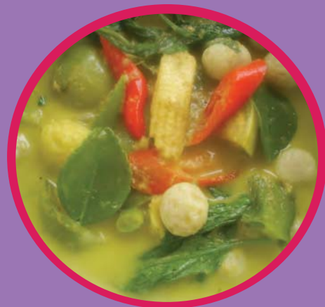
แกงเขียวหวาน