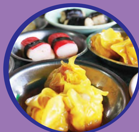
ขนมจีบ ต้มยำ