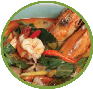
ต้มยำกุ้ง