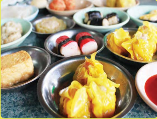
ขนมจีบ/ ตี๋มซ่า