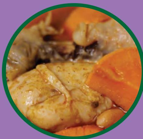
แกงมัสมั่น