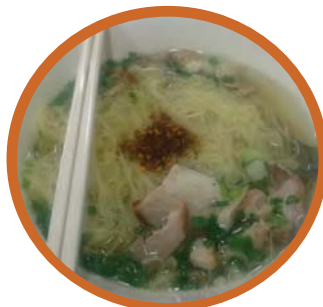
ก๋วยเตี๋ยว