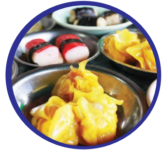
ขนมจีบ ต้มยำ