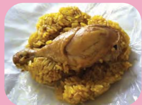
ข้าวหมกไก่