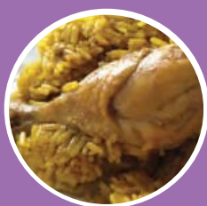
ข้าวหมกไก่

ผงกะหรี่ ขมิ้น พริกไทย อบเชย ยี่หร่า กระวาน ลูกผักชี กานพลู