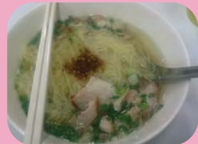
ก๋วยเตี๋ยว