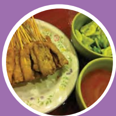
ไก่สะเต๊ะ