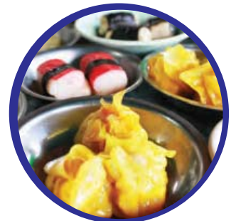
ขนมจีบ ต้มยำ