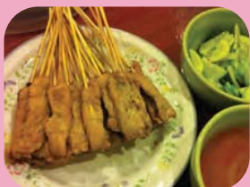
ไก่สะเต๊ะ