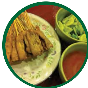
ไก่สะเต๊ะ