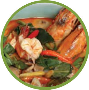
ต้มยำกุ้ง