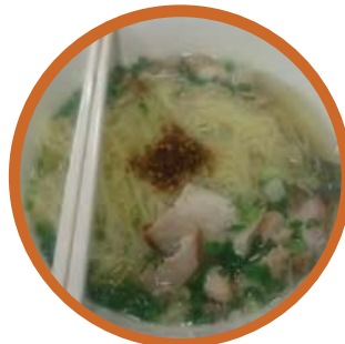
ก๋วยเตี๋ยว