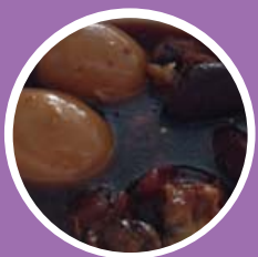
ไข่พะโล้