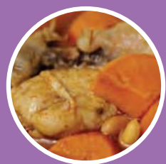
แกงมัสมั่น