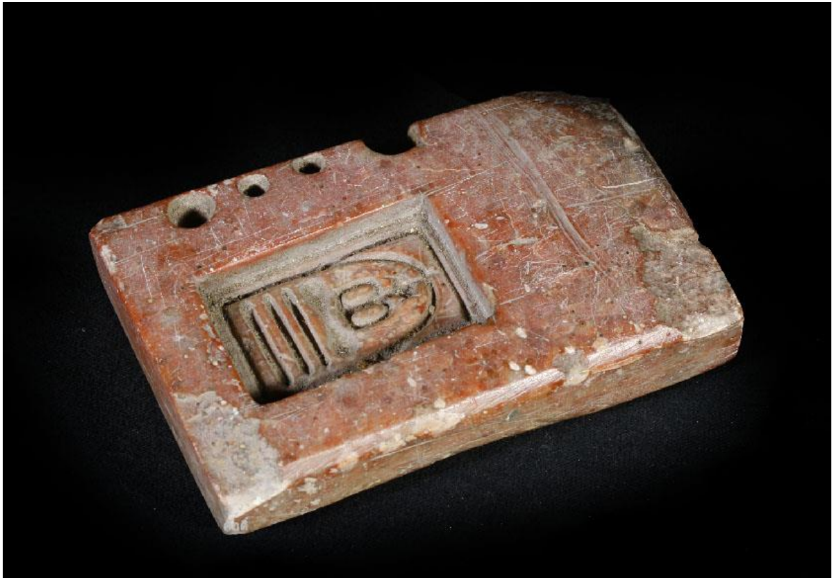
ภาพที่ ๑๔ : พิมพ์พระเครื่อง

อีกอย่างหนึ่งคือพระเครื่อง พระเครื่องในโบราณจะมีพระเครื่องดินเผา ใช้วิธีการกดดินลงไปบนแม่พิมพ์ แม่พิมพ์โบราณของสุโขทัยจะเป็นแม่พิมพ์ดินเผา พอต้นกรุงเราก็อพบพระทรงเครื่องรัตน ก็สรุปได้ว่าต้องมีแม่พิมพ์ อาจจะเป็นแม่พิมพ์ดินเผา หรือแม่พิมพ์หินสบู่ แต่พอเจอในช่วงรัชกาลที่ ๔-๕ น่าจะเริ่มมีการนำมาใช้ในแม่พิมพ์หินสบู่บ้าง