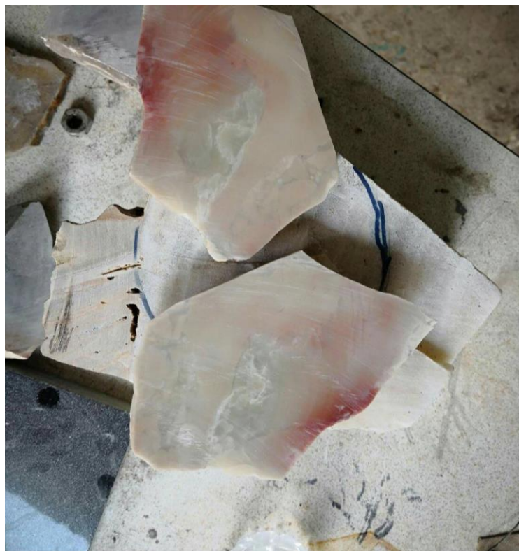
ภาพที่ ๓ : หินสบู่ที่ตัดแล้ว