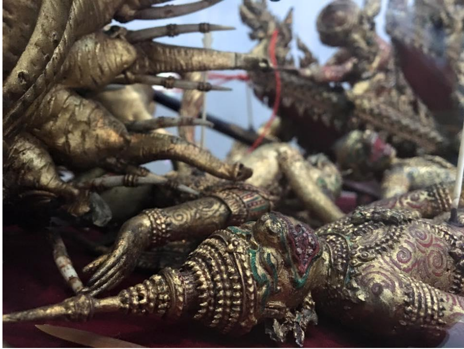
ภาพที่ ๑๒ : ตีตตัวละครเรื่องรามเกียรติ์ งานพระเมรุของของพระนางเจ้าสุนันทากุมารีรัตน์ และสมเด็จพระเจ้าลูกยาเธอเจ้าฟ้ากรมฯ ภาณุเพ็ชรรัตน์