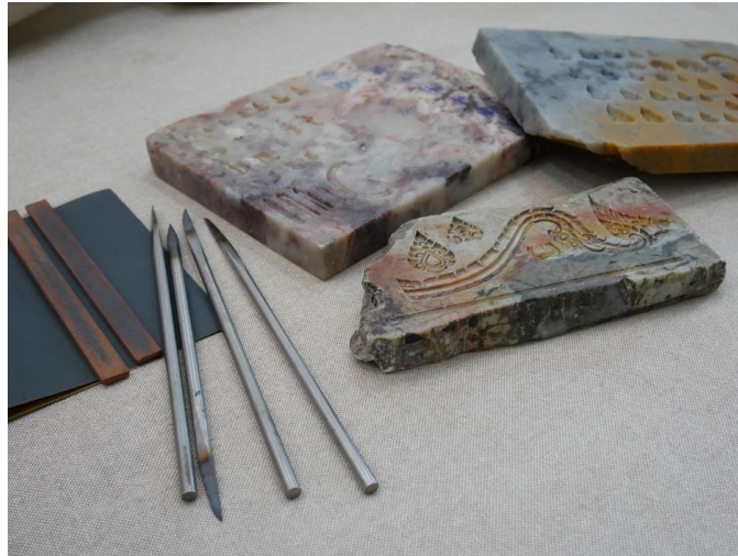
ภาพที่ ๔ : เครื่องมือแกะหินสบู่

การแกะแม่พิมพ์ลงบนหินสบู่ใช้สมองด้านซ้าย เขียนลายด้วยเหล็กแหลม ทำการแกะด้วยเหล็กสปริงหรือเหล็ก อย่างดี หาซื้อเครื่องมือแกะได้ตามร้านเครื่องมือทำจิวเวลรี่ (แถววงเวียน บ้านหม้อ ถนนเจริญกรุง) หรือ ช่างบางคนอาจทำเครื่องมือแกะหินใช้เองตามความถนัดก็ได้ แกะให้ลึกเปิดเนื้อลงไปเรื่อย แล้วใช้ดินน้ำมันค่อยทดลองกดแล้วยกขึ้นมาดูว่าน้ำหนักได้ไหม ความลึกได้ไหม มิติ เหลี่ยม สัน คม ต้องทดลองแกะลงไปเรื่อยๆ เครื่องมือแกะหิน ต้องหมั่นลับให้คมอยู่เสมอจึงจะได้ลายที่สวยงาม คม ชัดแจ่ม