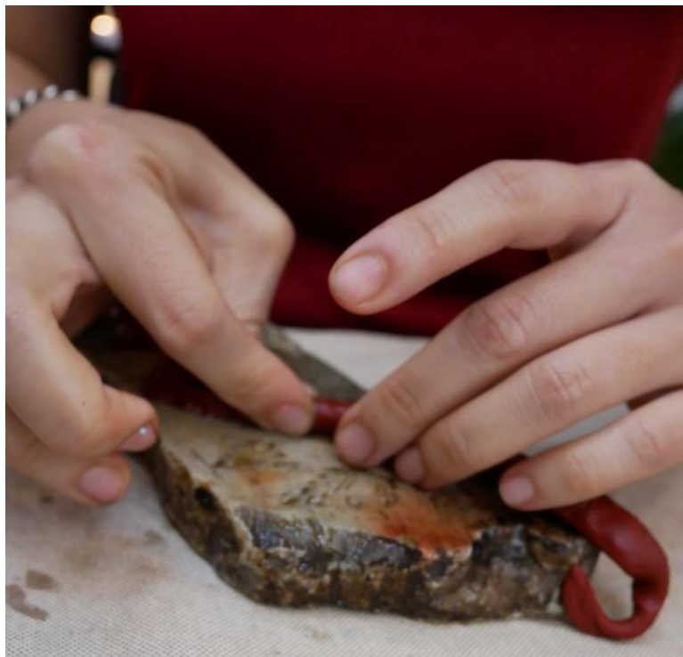
ภาพที่ ๑๕ : การตีลาย