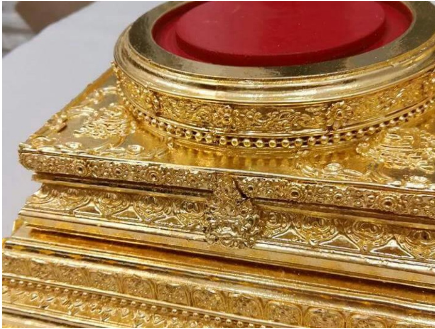
ภาพที่ ๒๐ : ประดับลายปิดทอง