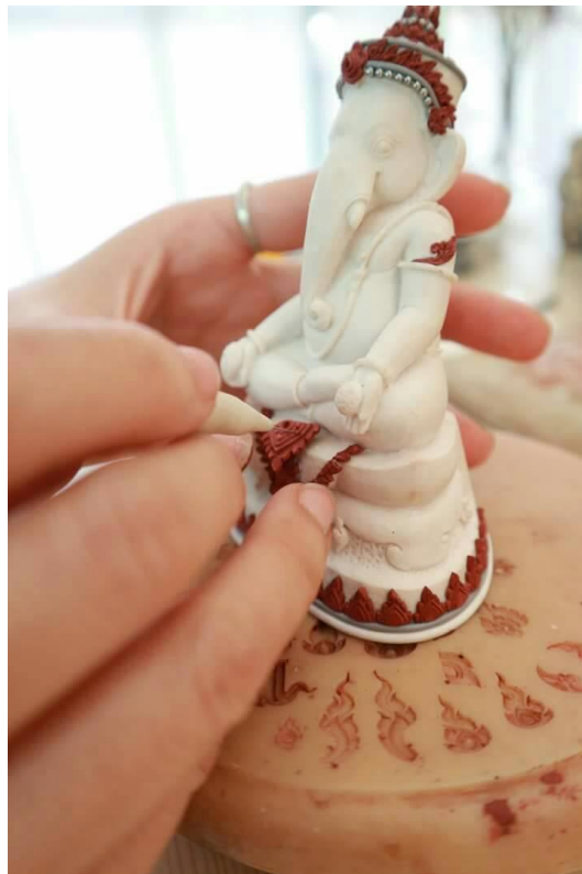
ภาพที่ ๑๙ : ประดับลายลงบนชิ้นงาน