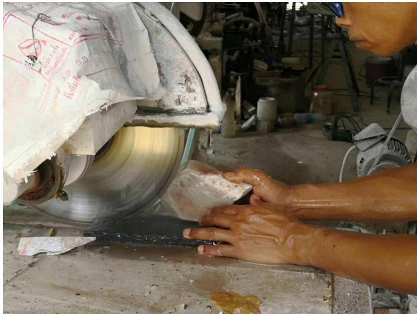
ภาพที่ ๒ : ตัดหินสบู่ด้วยเครื่องใบตัดน้ำ