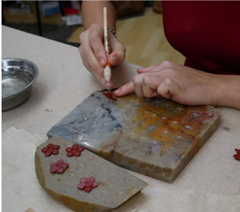
ภาพที่ ๑๖ : การตีลาย