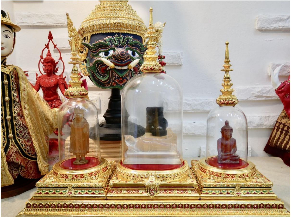
ภาพที่ ๒๓ : ฐานพระ