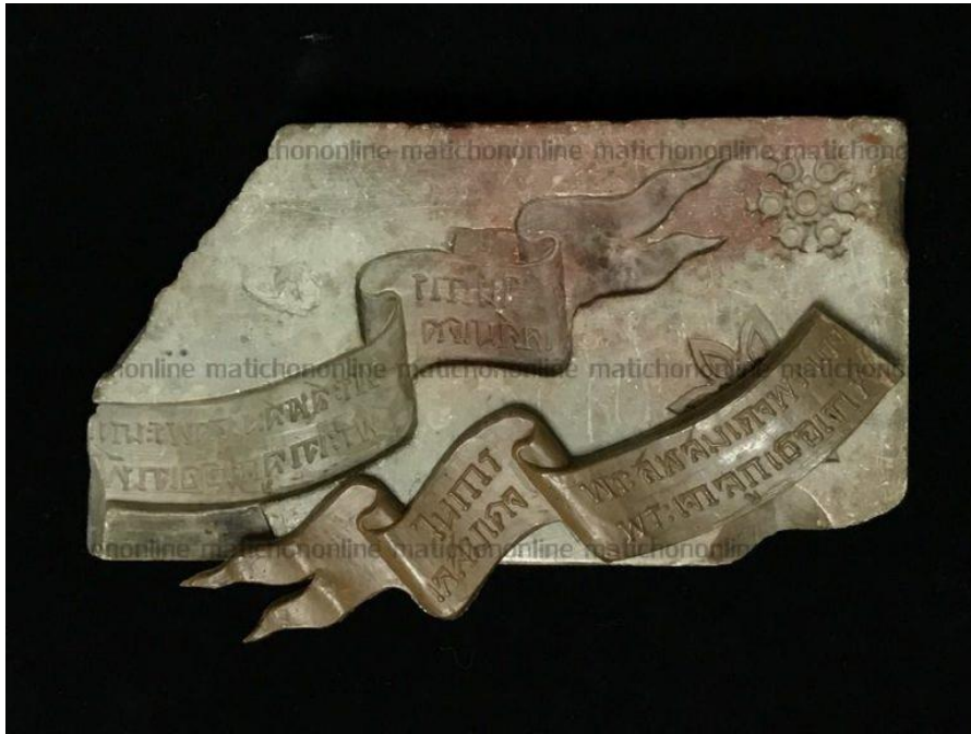
ภาพที่ ๙ : แม่พิมพ์หินสบูที่ใช้ในงานพระเมรุของของพระนางเจ้าสุนันทากุมารีรัตน์ และสมเด็จพระเจ้าลูกยาเธอเจ้าฟ้ากรมฯ ภาณุเพ็ชรรัตน์