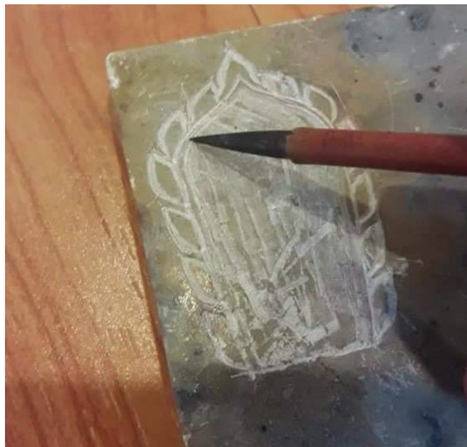
ภาพที่ ๕ : การแกะหินสบู่