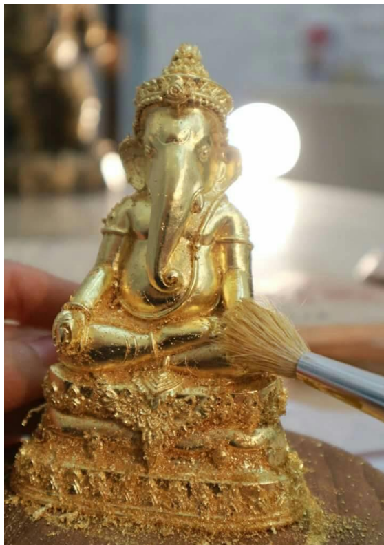
ภาพที่ ๒๑ : ประดับลายปิดทอง