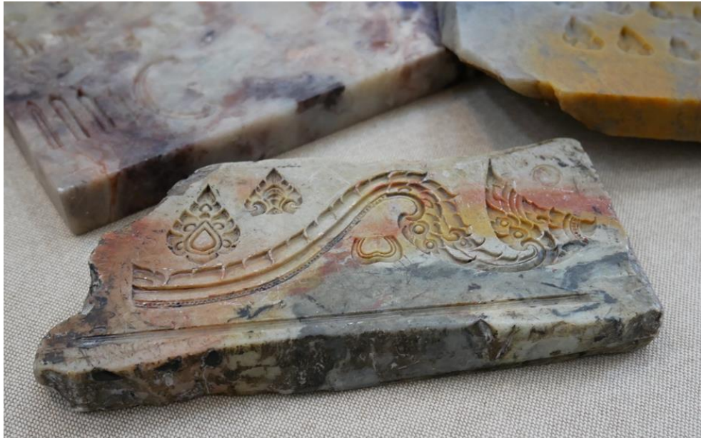
ภาพที่ ๖ : เครื่องมือแกะหินสบู่