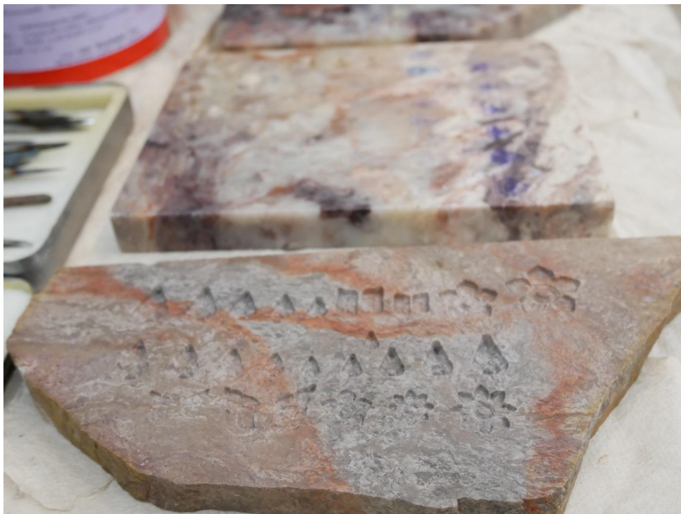
ภาพที่ ๗ : เครื่องมือแกะหินสบู่