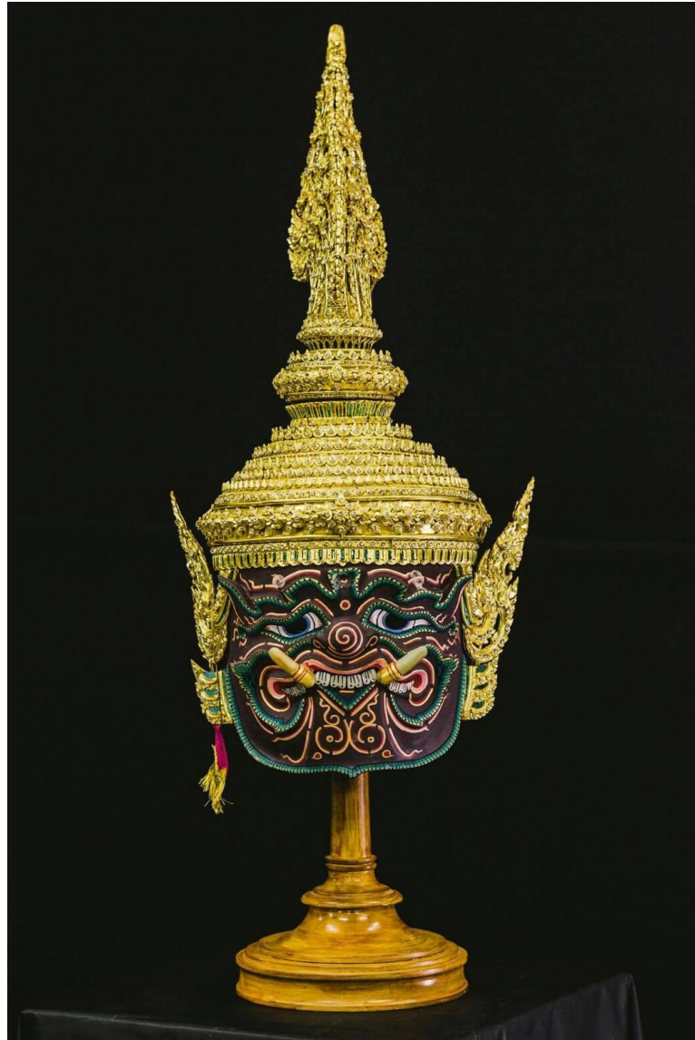
ภาพที่ ๒๒ : หัวโขน