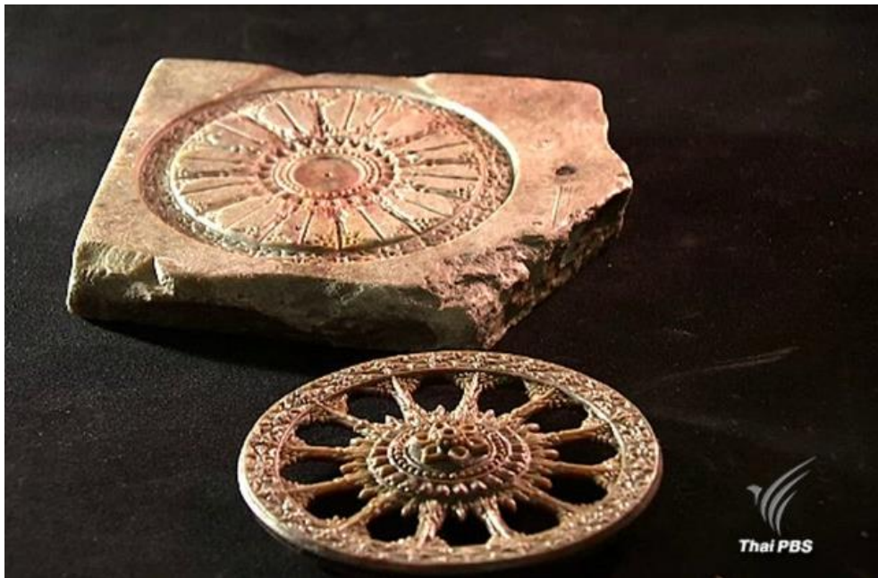
ภาพที่ ๑๐ : แม่พิมพ์หินสบูที่ใช้ในงานพระเมรุของของพระนางเจ้าสุนันทากุมารีรัตน์ และสมเด็จพระเจ้าลูกยาเธอเจ้าฟ้ากรมฯ ภาณุเพ็ชรรัตน์