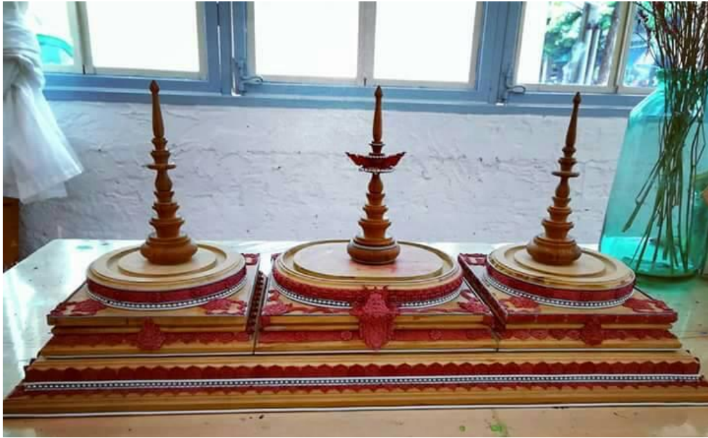
ภาพที่ ๑๘ : ประดับลายลงบนชิ้นงาน