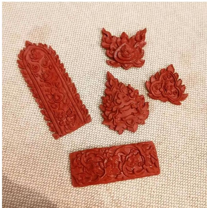
ภาพที่ ๑๗ : ตัวลายที่ตีออกมาจากแม่พิมพ์หินสปู