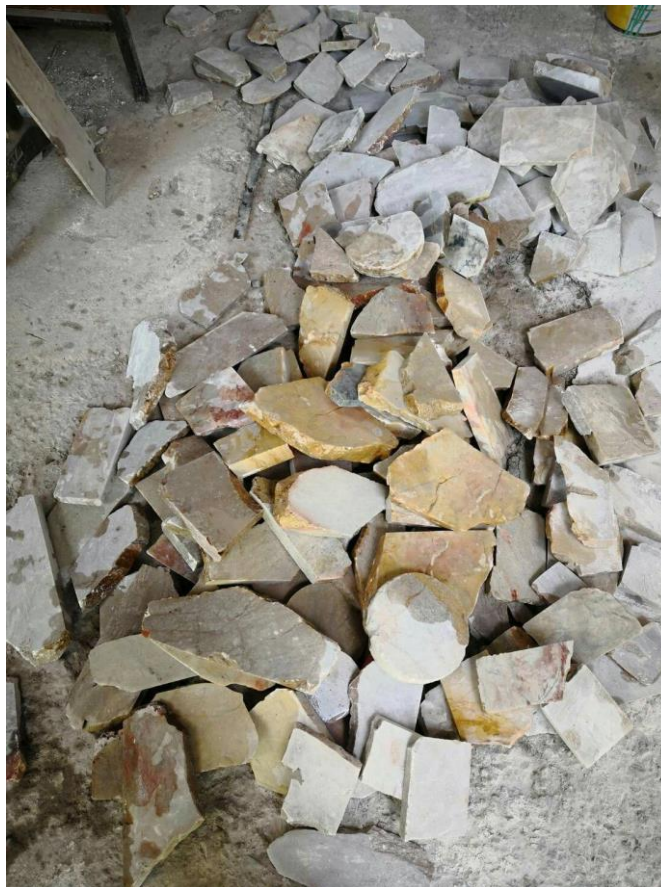
ภาพที่ ๑ : หินสบู่

หินสบู่เป็นหินที่เกิดจากธรรมชาติ คุณสมบัติสามารถทำได้หลายอย่าง เช่น ครีမ် แป้ง เมื่อบดละเอียดจะเป็นผงแป้ง มีความมัน ลื่น สามารถใช้ในเครื่องสำอางได้บางส่วน ตามข้อมูลของกรมวิทยาศาสตร์ และธรณีวิทยาที่ให้ไว้ ในบ้านเราจะพบมากที่สุดอยู่ที่จังหวัดนครนายก ตอนนี้เหมืองปิดไปแล้ว เพราะหินสบู่เป็นวัสดุที่ถูกขึ้นทะเบียน ใครที่มีไว้ในครอบครองเป็นจำนวนมากจะต้องแจ้งจดทะเบียน หินสบู่ในบ้านเราตอนนี้ที่ยังมีซื้อขายกันอยู่ในปัจจุบัน คือ โรงแกะสลักที่นครนายก ยังมีบางที่ที่เก็บหินสบู่ไว้เป็นจำนวนมาก ราคา กิโลกรัมละ ๑๕๐ บาท ถ้าอยากได้ในราคาถูกต้องซื้อเป็นจำนวนมากถึงจะคุ้ม และต้องส่งล่วงหน้าเพื่อให้ทางโรงแกะสลักตัดให้ ตัดด้วยเครื่องใบตัดน้ำ สามารถสั่งขนาดความหนา และความยาวได้ตามที่ต้องการ เมื่อได้หินมาผิวจะเป็นผ้าสีขาวให้อาบน้ำมันมะกอกทาทิ้งไว้ ปัจจุบันมีการขายผ่านทางอินเทอร์เน็ต คือ หินสบู่ลาว หินสบู่ลาวจะมีข้อดีกว่าหินสบู่บ้านเรา คือ มีแร่เยอะกว่า หินสบู่ที่ดีเวลายกขึ้นมาส่องแดงผ่านแสงจะต้องใส ยิ่งถ้าเป็นสีแดงจะหายากมาก นี่คือหินสบู่คร่าวๆในประเทศไทย แหล่งอื่นยังไม่ค่อยพบเห็น นับวันยิ่งน้อยลงไปเรื่อยๆ และมีผลกระทบต่อช่างที่ต้องการนำหินสบู่มาใช้ และผู้ที่สามารถแกะใช้เองได้ก็ลดน้อยลงด้วยเช่นกัน