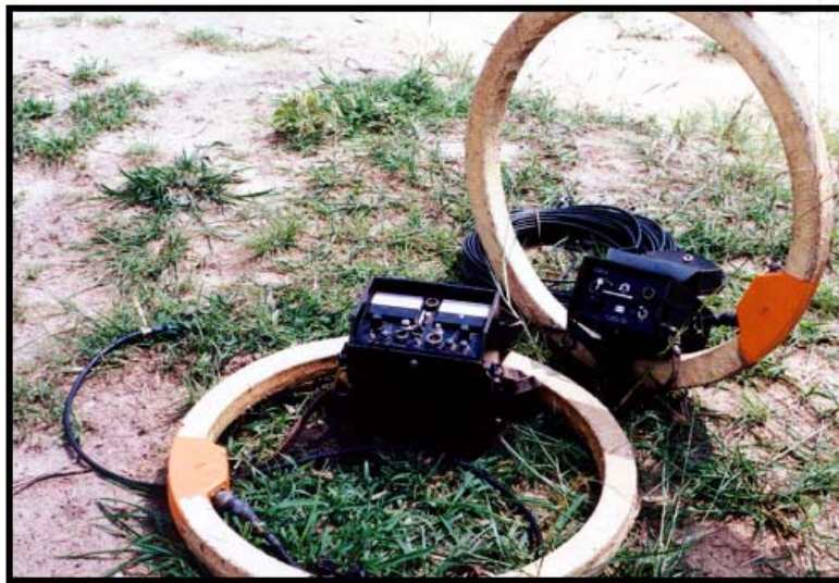
ภาพภาคผนวกที่ 2 ภาพเครื่องวัดค่าการนำไฟฟ้า Electromagnetic Terrain Conductivity (EM 34-3)

ไฟฟ้าของชั้นดินในระดับความลึก 0-7.5, 0-15 และ 0-30 เมตร (ECa, apparent electrical conductivity, mS/m) หลักการของเครื่องมือ คือ เครื่องจะปล่อย low frequency radio wave ลงไปในดิน แล้วมีตัวรับสัญญาณผ่านกลับมาจากชั้นดิน จากการศึกษาพบว่าค่า ECa มีความสัมพันธ์กับปริมาณของเกลือที่อยู่ในดิน เนื้อดิน ความชื้น และแร่ธาตุ (McNeill, 1980) ในกรณีที่ต้องการทราบค่า electrical conductivity (ECa) ของดิน จำเป็นต้องเก็บตัวอย่างในระดับความลึก ดังกล่าวเพื่อหาความสัมพันธ์ระหว่างค่าเหล่านี้ ซึ่งจะสิ้นเปลืองค่าใช้จ่ายมาก ในกรณีที่ต้องการสำรวจความเค็มของดินในบริเวณที่มีพื้นที่กว้างมาก ค่า ECa ก็สามารถที่จะยอมรับได้ในระดับหนึ่ง โดยสามารถจำแนกค่าความเค็มออกเป็น 3 ระดับ คือ ต่ำ-ปานกลาง (40-80 mS/m) ปานกลาง-สูง (80-160 mS/m) และสูงมาก (>160 mS/m) (Williams et al., 1990)