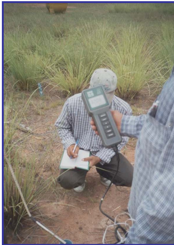
ภาพภาคผนวกที่ 1 ภาพเครื่องมือวัดค่าการนำไฟฟ้าในสนาม

ถ้าต้องการจะทราบว่าพื้นที่บริเวณนั้นจะมีค่าความเค็มของดินมากน้อยขนาดไหน เพื่อที่จะได้ทราบข้อมูลพื้นฐานแต่ยังไม่ถึงกับละเอียดเราสามารถปฏิบัติงานในภาคสนามโดยใช้วิธีการเก็บตัวอย่างดิน นำมาละลายกับน้ำในอัตราส่วน 1:5 แล้วคนให้เนื้อดินและน้ำเข้ากัน ทิ้งไว้สักครู่ แล้วจึงทำการวัดด้วยเครื่องวัดค่าการนำไฟฟ้า ก็สามารถจะคาดคะเนได้ว่าพื้นที่มีความเค็มขนาดไหน จากนั้นจึงเก็บตัวอย่างดินไปตรวจวัดในห้องปฏิบัติการอีกครั้ง เพื่อให้ข้อมูลมีความละเอียดมากขึ้น และเครื่องมือนี้ยังวัดค่าการนำไฟฟ้าของน้ำที่มีความเค็มด้วย