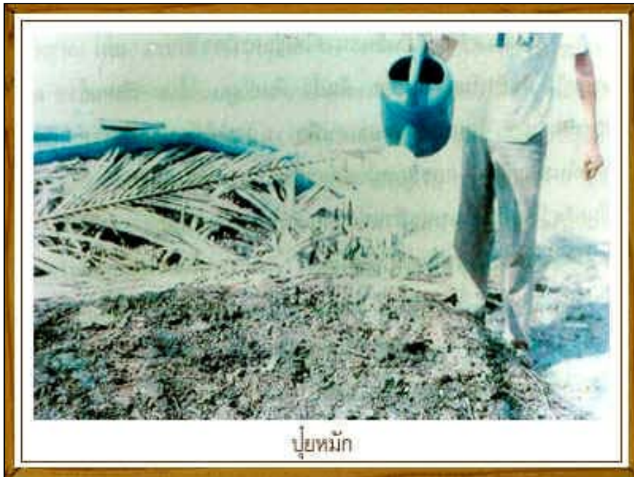
ปุ๋ยหมัก

3.1.3 ปุ๋ยหมัก (compost) ปุ๋ยหมักเป็นปุ๋ยอินทรีย์ชนิดหนึ่ง ซึ่งได้จากการนำชิ้นส่วนของพืชมาหมักในรูปของการกองซ้อนกันบนพื้นที่ดินหรือในหลุมเศษชิ้นส่วนของพืชที่นำมาหมักนั้นจะต้องผ่านกระบวนการย่อยสลายจนแปรสภาพไปจากรูปเดิมโดยกิจกรรมของจุลินทรีย์จนกระทั่งได้สารอินทรีย์วัตถุที่มีความคงทนไม่มีกลิ่น มีสีน้ำตาลปนดำและมีอัตราส่วนของสารประกอบคาร์บอนต่อไนโตรเจนต่ำ เมื่อกระบวนการย่อยสลายเศษพืชและวัสดุเสร็จสมบูรณ์จะได้ปุ๋ยหมัก สำหรับใช้ประโยชน์ในปรับปรุงและบำรุงดิน (กรมพัฒนาที่ดิน, ไม้ระบุนปีที่พิมพ์)