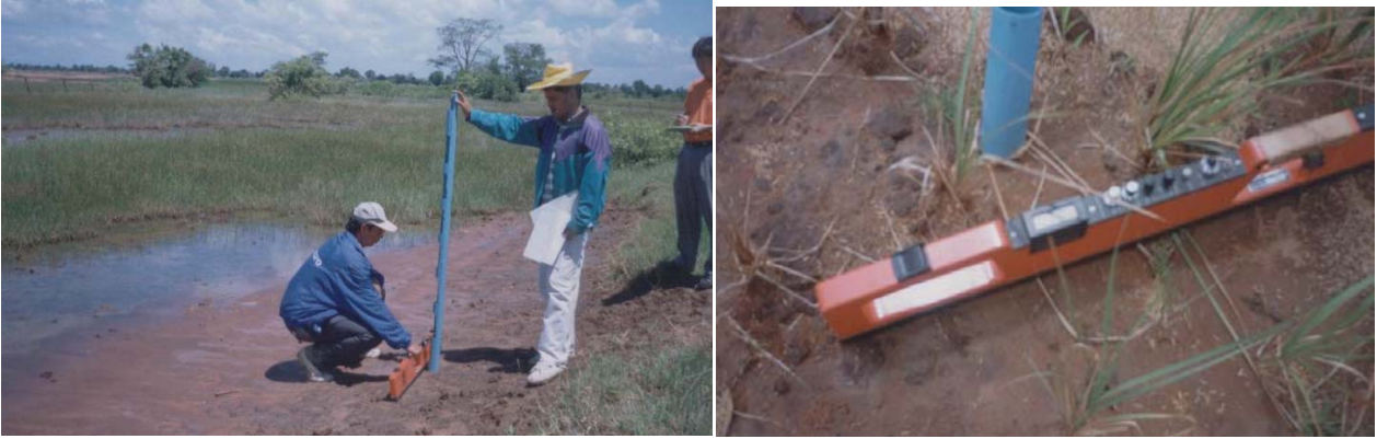
ภาพภาคผนวกที่ 3 ภาพเครื่องวัดการนำไฟฟ้า EM 38

ตารางภาคผนวกที่ 1 การจำแนกระดับความเค็มที่มีผลกระทบต่อพืช (U.S. Soil Salinity Laboratory Staff 1954)