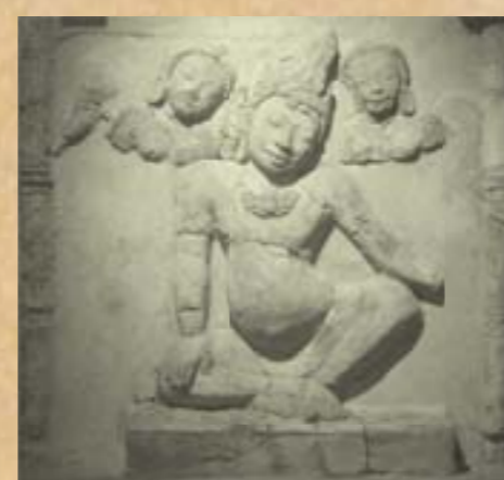
ภาพท้าวภูเวร ภาพท้าวภูเวร เทพแห่งความมั่งคั่งและโชคลาภ ตามคติความเชื่อแบบอินเดีย เป็นที่เคารพนับถือของชาวทวารวดี