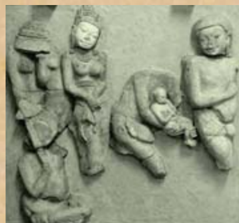
ภาพสุรชชาดก ภาพเล่าเรื่องสุรชชาดก ตอนกษัตริย์ผู้ทำทานบารมีด้วยการยกโอรส มเหสี และตนเองให้แก่ยักษ์กระหายเลือด ซึ่งแฝงคติธรรมเรื่องการให้การเสียสละ