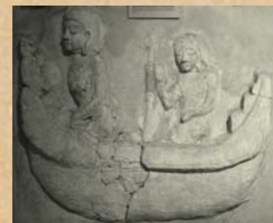
ภาพสุปาระชชาดก ภาพเล่าเรื่องสุปาระชชาดก ตอนนายเรือสุปาระชชเดินทางไปกับพ่อค้า และรอดพ้นอันตรายจากพายุด้วยศรัทธาในพระพุทธเจ้า ซึ่งแฝงคติธรรมเรื่องการตั้งมั่นในศรัทธา