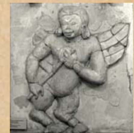
ภาพกนิกร ภาพกนิกร (สัตว์ครึ่งคนครึ่งนก) ในจินตนาการจากป้าหิมพานต์ ในมือถือเครื่องดนตรีคล้ายพิณเป็ยะ ซึ่งมีลักษณะใกล้เคียงกับเครื่องดนตรีโบราณของอินเดีย แสดงให้เห็นถึงรูปแบบของเครื่องดนตรีในยุคสมัยทวารวดี