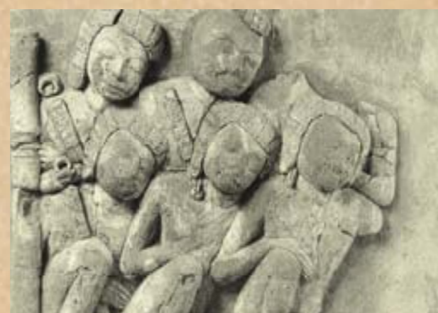
ภาพบุคลล ภาพปูนปั้นแสดงลักษณะกลุ่มคนแต่งกายคล้ายทหาร มือถืออาวุธคล้ายมีดหรือดาบมีใบหน้าตาแบบชาวทวารวดี คือ คิ้วตอกัน ตาโปน จมูกใหญ่ ปากหนา มีใบหูยาว สวมต่างหูที่มีลักษณะเดียวกันกับต่างหูจริงที่ค้นพบ