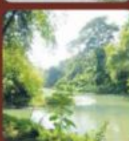
แม่น้ำเพชรบุรี