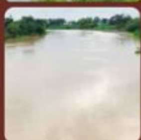
แม่น้ำเจ้าพระยา