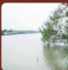
แม่น้ำราชบุรี