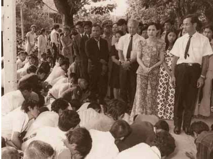
นิสิตนักศึกษาหนีภัยจากการจลาจล ๑๔ ตุลาคม ๒๕๑๖ เข้าพึ่งพระบารมีในสวนจิตรลดา

สมัครที่เสียชีวิต บาดเจ็บและพิการแล้ว มูลนิธิยังฝึกสอนวิชาชีพให้แก่ทหารตำรวจและอาสาสมัครที่พิการ และนำผลงานออกจำหน่ายเป็นรายได้ให้แก่ผู้พิการเหล่านี้ด้วย