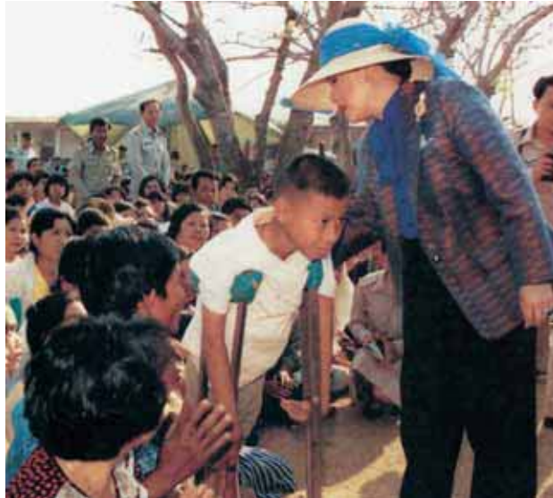
เด็กชายจาก จังหวัดเชียงราย คนนี้ได้รับ พระราชทาน พระบรมราชา นุเคราะห์ทั้งด้าน การรักษาพยาบาล และการศึกษา