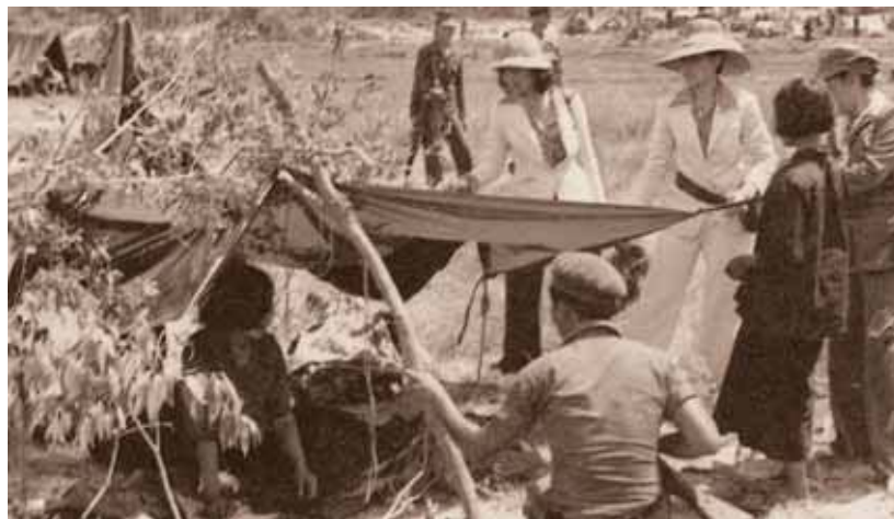
เสด็จพระราชดำเนินไปทอดพระเนตรสภาพความเป็นอยู่ของบรรดา ผู้อพยพลี้ภัยชาวกัมพูชาที่จังหวัดตราด

ศูนย์เวชศาสตร์ฟื้นฟู มีหน้าที่จัดให้มีการฟื้นฟูสมรรถภาพแก่ผู้ป่วยและผู้พิการจากโรคภัยและอุบัติเหตุ