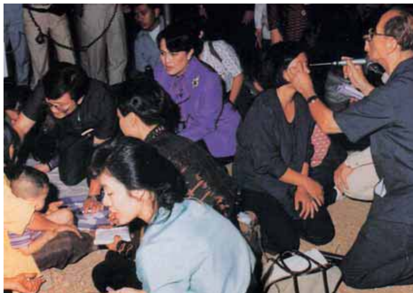
ทอดพระเนตรการทำงานของหน่วยแพทย์พระราชทาน ในโอกาสเสด็จพระราชดำเนินไปทรงเยี่ยมราษฎรบ้านแม่ต๋ำ อำเภอเสริมงาม จังหวัดลำปาง

เพื่อส่งเสริมความเป็นอยู่ของราษฎร ในระยะแรกของการเสด็จ พระราชดำเนินไปทรงเยี่ยมราษฎรในต่างจังหวัด เมื่อทรงพบว่าราษฎรที่มา เฝ้าทูลละอองธุลีพระบาทรับเสด็จ มีอาการเจ็บป่วย สมเด็จพระนางเจ้าฯ พระบรมราชินีนาถได้มีพระราชเสาวนีย์ให้แพทย์ที่ตามเสด็จไปในขบวน ตรวจอาการ จ่ายยา และให้คำแนะนำแก่ราษฎรในการดูแลรักษาตนเอง แต่หากยังไม่สามารถวินิจฉัยโรคได้ในขณะนั้น หรือเป็นโรคที่ร้ายแรง จะมี พระราชเสาวนีย์ให้ส่งไปรับการรักษาที่โรงพยาบาลซึ่งอยู่ใกล้ท้องถิ่นนั้น โดยพระราชทานหนังสือรับรองว่าเป็นคนไข้ในพระบรมราชานุเคราะห์ พร้อมค่าเดินทาง และค่าใช้จ่ายที่จำเป็น ส่วนค่ารักษาพยาบาลและค่ายา นั้น จะพระราชทานแก่โรงพยาบาลโดยตรง หากผู้ป่วยไม่สามารถไปเองได้ จะทรงจัดเจ้าหน้าที่นำไป และพระราชทานค่าใช้จ่ายแก่เจ้าหน้าที่ด้วย ถ้าโรงพยาบาลที่อยู่ใกล้ท้องถิ่นนั้นขาดบุคลากรทางการแพทย์หรือเครื่องมือ เครื่องใช้ในการรักษา ก็ให้ส่งไปรับการรักษาที่โรงพยาบาลในกรุงเทพฯ