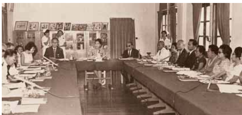
สมเด็จพระองค์สมเด็จพระนางยิกาสภาอากาศไทย เสด็จพระราชดำเนินไปทรงประชุมสภาอากาศ ครั้งที่ ๑๔๓ ณ ห้องประชุม ตึกบริพัตร โรงพยาบาลจุฬาลงกรณ์ วันที่ ๒๘ กุมภาพันธ์ ๒๕๐๙