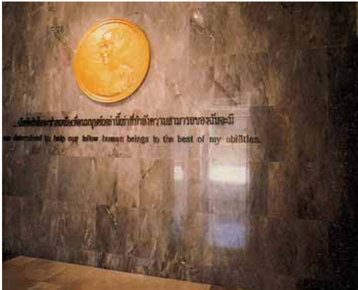
พระรูปปั้นนูนต่ำ (Bas-Relief) ในศาลาราชการุณย์

สงครามอันโหดเหี้ยมจากผู้ร่วมชาติเดียวกัน ผ่านป่าดงดิบที่อกเขาบรรทัด และอันตรายรอบด้านเข้ามาพึ่งพระบรมโพธิสมภารเป็นเวลายาวนานถึง ๗ ปี ได้เปลี่ยนสภาพไป ปรากฏเป็นอาคารสถานที่ดังต่อไปนี้