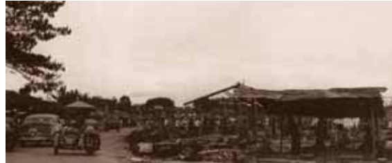
ทรงเยี่ยมราษฎรที่ประสบอัคคีภัย ที่อำเภอบ้านโป่ง จังหวัดราชบุรี เมื่อวันที่ ๑๓ กันยายน พ.ศ. ๒๔๙๗

พระบรมราชินีนาถก็ได้ทรงแบ่งเบาพระราชภาระต่างๆมาโดยตลอด โดยเฉพาะอย่างยิ่ง พระราชกรณียกิจด้านสาธารณสุข สังคมสงเคราะห์ และการพัฒนาชีวิตความเป็นอยู่ของราษฎรในชนบทให้มีความรู้ มีงาน มีรายได้ สามารถดำรงชีวิตอย่างมีสุขอนามัย