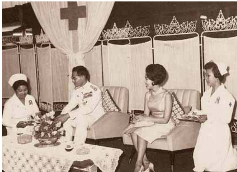
พระบาทสมเด็จพระเจ้าอยู่หัวและสมเด็จพระนางเจ้าฯ พระบรมราชินีนาถ เสด็จพระราชดำเนินไปในงานกาชาด ประจำปี ๒๕๐๙

พระราชกรณียกิจด้านสาธารณสุขและสังคมสงเคราะห์