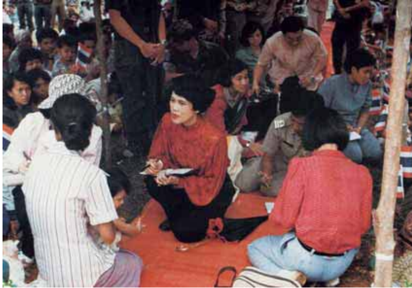
เสด็จพระราชดำเนินไปทรงเยี่ยมราษฎรบ้านกาหลง อำเภอรือเสาะ จังหวัดนราธิวาส ทรงชักประวัติราษฎรผู้มีปัญหาในการทำกินเพื่อทรงหาวิธีช่วยเหลือ

โดยพระราชทานค่าเดินทางและค่ารักษาพยาบาลทั้งหมด ในการเสด็จพระราชดำเนินไปทรงเยี่ยมราษฎรต่างจังหวัด หรือขณะแปรพระราชฐานไปประทับที่พระราชนิเวศน์ในภูมิภาคต่างๆ มีราษฎรที่เจ็บไข้มาขอรับพระราชทานความช่วยเหลือเป็นจำนวนมาก ต้องมีแพทย์และพยาบาลอาสาไปช่วยปฏิบัติงานเพิ่มขึ้น แล้วยังใช้เวลามากขึ้นจนมีเดิค่า หลายครั้งที่สมเด็จพระนางเจ้าฯ พระบรมราชินีนาถ และพระราชโอรสพระราชธิดาทรงช่วยซักถามประวัติและอาการของผู้ป่วย ตลอดจนช่วยแพทย์ในการจ่ายยา และการบันทึกเพื่อติดตามผล นอกจากนี้โรงพยาบาลในท้องถิ่นมักมีความจำกัดในด้านเครื่องเวชภัณฑ์และยารักษาโรค สมเด็จพระนางเจ้าฯ พระบรมราชินีนาถ จึงพระราชทานพระราชทรัพย์ เพื่อจัดซื้อเครื่องมือเครื่องใช้และยาเพิ่มขึ้น หน่วยงานต่างๆ ได้ร่วมช่วยเหลือคนไข้ในพระบรมราชานุเคราะห์ เช่น ตำรวจตระเวนชายแดนช่วยนำคนไข้ไปส่งโรงพยาบาล การรถไฟแห่งประเทศไทยออกใบเบิกทางให้คนไข้และญาติแทนค่าโดยสาร โรงพยาบาลลดค่ารักษาพยาบาลให้ ฯลฯ ในระหว่างที่ราษฎรผู้เจ็บป่วย