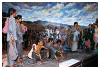
หุ่นจำลองขนาดเท่าพระองค์คนจริง ของจริง ที่ศูนย์ราชกาคุณย์