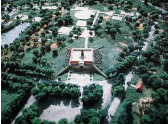
แบบจำลองศูนย์ สภาอากาศไทยบ้านเขา ล้าน จังหวัดตราด