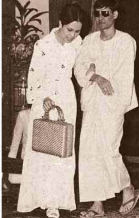
สมเด็จพระบรมราชินีนาถ ทรงจุงทหารพิการ

ส่งไปเรียนที่โรงเรียนสอนคนตาบอด โรงเรียนสอนคนหูหนวก ให้อ่านหนังสือ หรือรู้ภาษามือเพื่อการสื่อสาร จะได้ดำรงชีวิตสะดวกขึ้น ถ้าพิการที่แขนหรือขา จะพระราชทานอุปกรณ์สำหรับคนพิการ หากเป็นผู้ที่มีอายุเลยวัยเรียนแล้ว ทรงส่งไปฝึกอาชีพที่สมาคมมูลนิธิ หรือหน่วยงานตามที่คนพิการสนใจและสามารถทำได้ โดยพระราชทานค่าใช้จ่ายให้