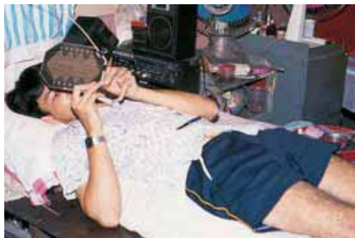
ผู้พิการนอนसानยานลิเกา ทำให้เกิดความเพลิดเพลิน และมีรายได้

สามารถจักสานยานลิเกาได้อย่างสวยงาม ทำให้ได้รับเงินพระราชทานไว้ ใช้จ่ายส่วนตัว หลายรายได้รับพระราชทานรางวัลพิเศษเพิ่ม ทำให้ผู้พิการ ที่เป็นสมาชิกจักสานยานลิเกา รู้สึกภาคภูมิใจในฝีมือของตน และมีกำลัง ใจที่จะต่อสู้ชีวิตต่อไปโดยไม่ท้อแท้ นอกจากนั้น สมเด็จพระนางเจ้าฯ พระบรม ราชินีนาถยังทรงพระกรุณาโปรดเกล้าโปรดกระหม่อมให้ปรับปรุงสภาพ ความเป็นอยู่และที่พักของผู้พิการเหล่านี้ให้ดีขึ้นด้วย