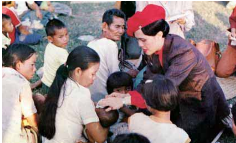
ทรงหยอดตาพระราชทานแก่เด็กที่มารับการตรวจรักษาจากแพทย์ที่โดยเสด็จพระราชดำเนิน ไปทรงเยี่ยมราษฎรบ้านหนองม่วง อำเภอสองดาว จังหวัดสกลนคร

“...การที่คนไทยเรายึดหลักอุดมคติว่า ความทุกข์สุข ไม่ใช่เป็นเรื่องเฉพาะบุคคล หรือเฉพาะครอบครัวใดครอบครัวหนึ่งเท่านั้น เป็นความคิดที่ทันสมัยในโลกปัจจุบัน เราจะมีความสุขแต่ลำพัง โดยไม่คำนึงถึงความเดือดร้อนของคนอีกหลายคนในแวดล้อมเรายู่นั้นไม่ได้ ผู้มีเมตตาจิตหวังประโยชน์ส่วนรวม ย่อมรู้จักแบ่งปันความสุขเพื่อผู้อื่น และพร้อมที่จะช่วยบรรเทาความทุกข์ของผู้อื่นตามกำลังและโอกาสเสมอ...”