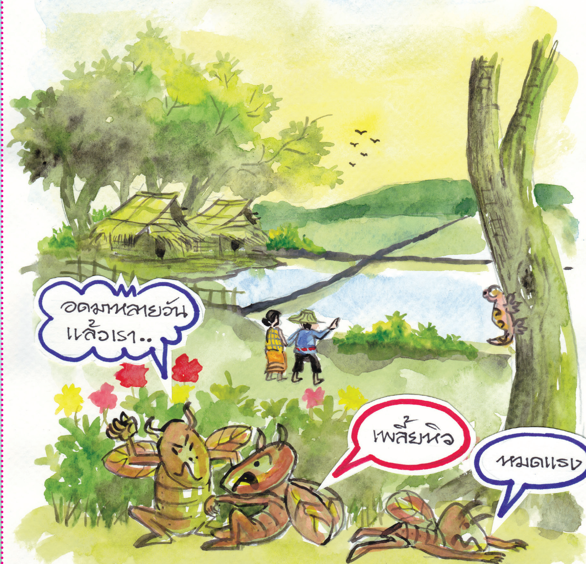
๙: ลอการปลูกข้าวโดยพร้อมเพรียงกัน

การปักนพร้อมเพรียงกันทั้งหมด ทำให้เพลี้ยไม่มีแหล่งอาหารดำรงชีพ