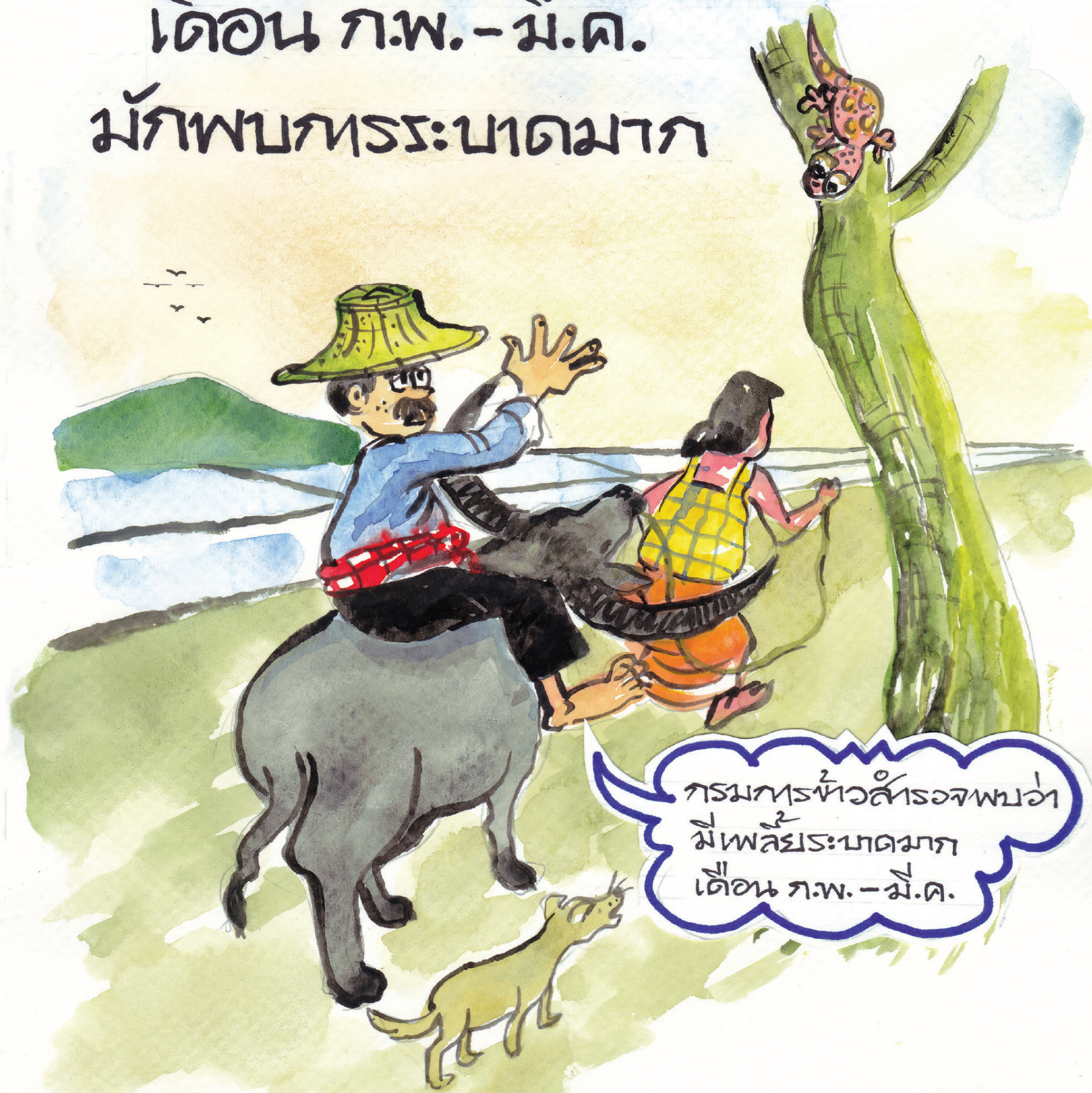
๙: ลอการปลูกข้าวโดยพร้อมเพรียงกัน

หลีกเลี่ยงการทำนา เดือน ก.พ.-มี.ค. มักพบกระบาดมาก