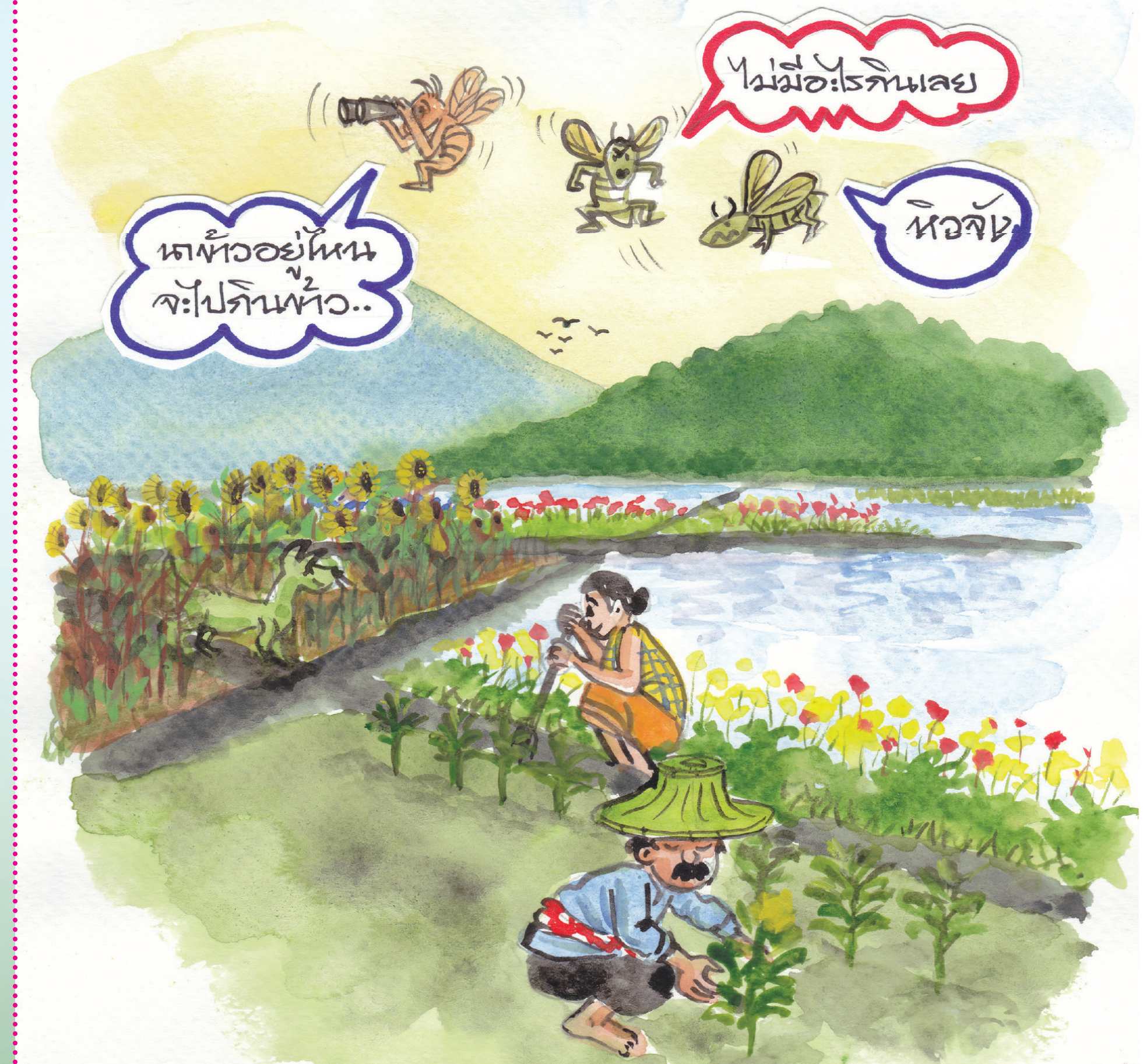
๙: ลอการปลูกข้าวโดยพร้อมเพรียงกัน

การปลูกที่ขึ้นเนินนาทั่วทั้งชุมชน ช่วยตัดวงจรอาหารของเพลี้ย..