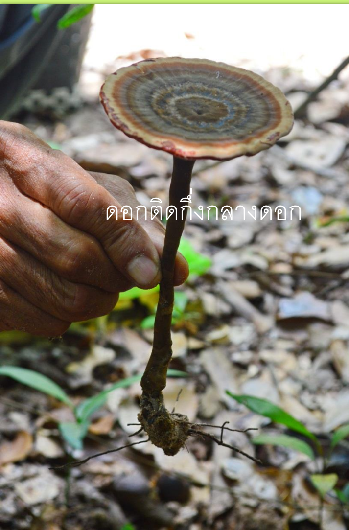
ดอกติดกึ่งกลางดอก

ลักษณะ ใต้หมวกเป็นรูสีขาว เมื่อสัมผัส เปลี่ยนเป็นสีแดง ก้านค่อนข้างกลม ดอกติด กึ่งกลางดอก หรือเยื้องเล็กน้อยสีน้ำตาล