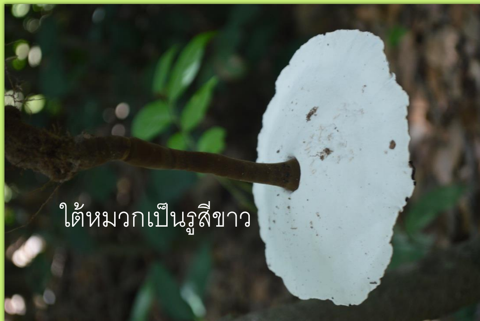
ใต้หมวกเป็นรูสีขาว

ลักษณะ ใต้หมวกเป็นรูสีขาว เมื่อสัมผัส เปลี่ยนเป็นสีแดง ก้านค่อนข้างกลม ดอกติด กึ่งกลางดอก หรือเยื้องเล็กน้อยสีน้ำตาล